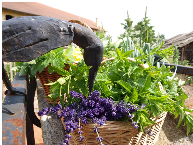
Festival květin, rostlin a bylin (foto M. Stehlíková)