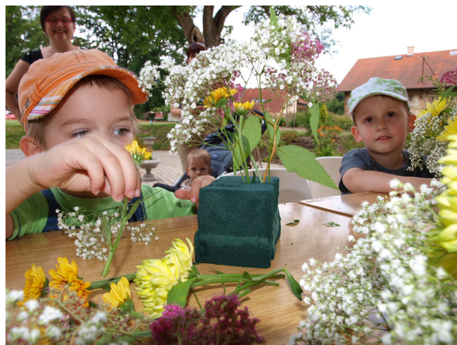
Festival květin, rostlin a bylin