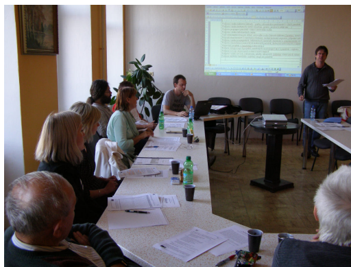
Z jednání pracovní skupiny Kulturní dědictví a cestovní ruch