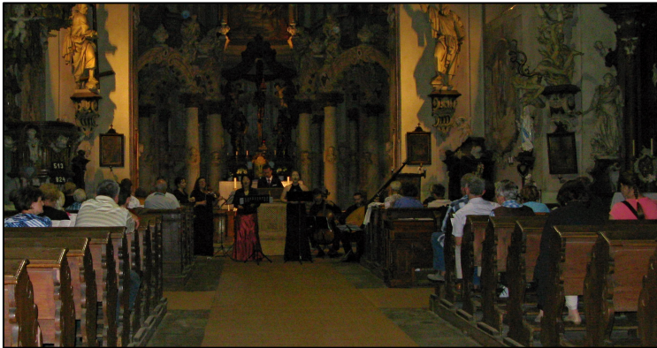
Z koncertu barokní hudby – Ensemble Inégal