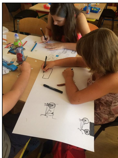
Z Animačního soustředění mladých historiků a techniků