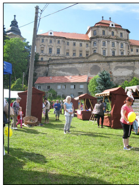
Z akce Chotěšovský slunovrat