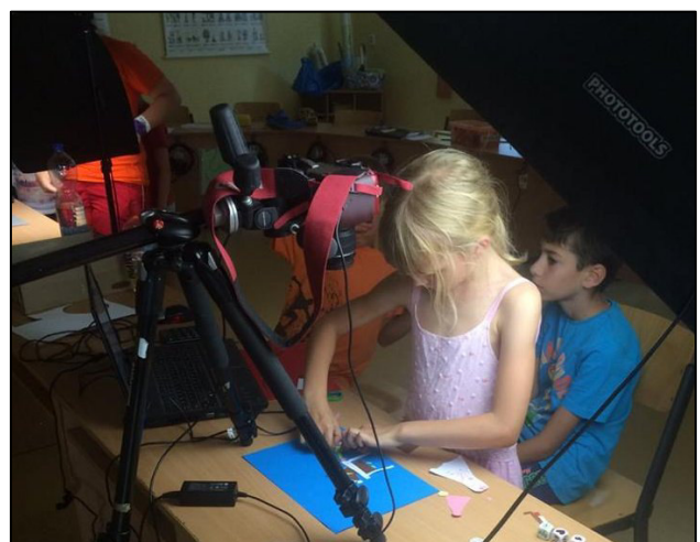
Z Animačního soustředění mladých historiků a techniků