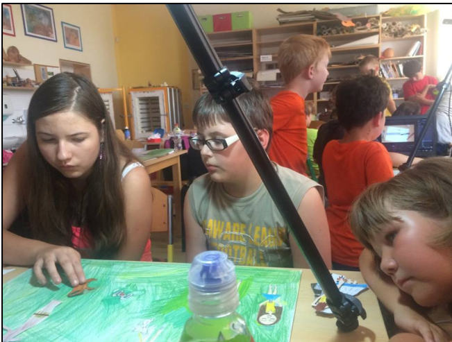
Z Animačního soustředění mladých historiků a techniků