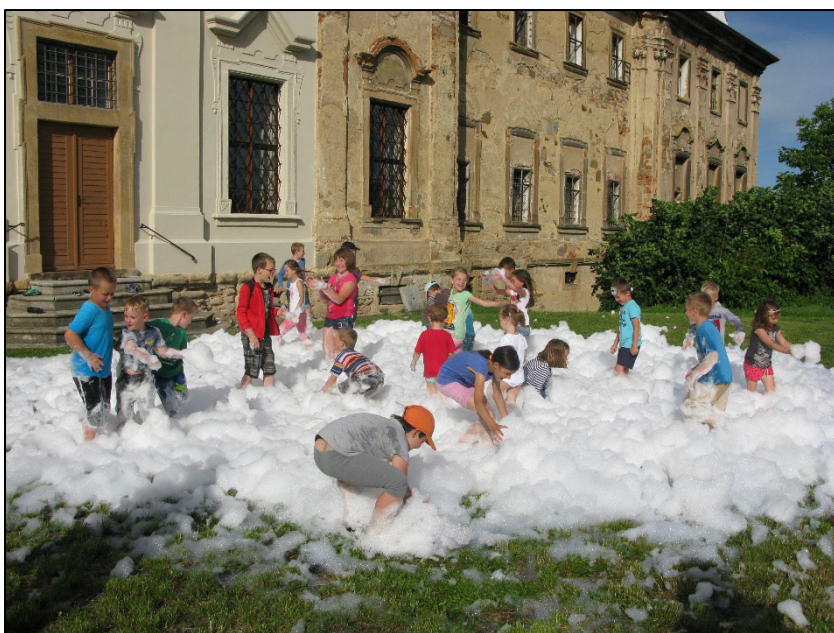
Z akce Chotěšovský slunovrat