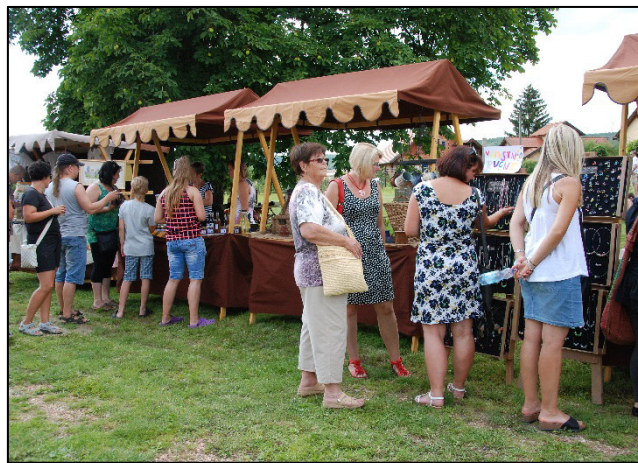
Z akce Baroko na bylinkovém panství Rochlov