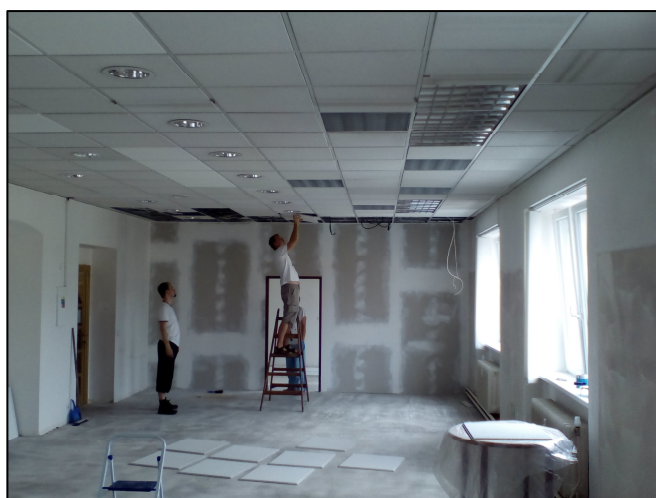
Z průběhu rekonstrukce