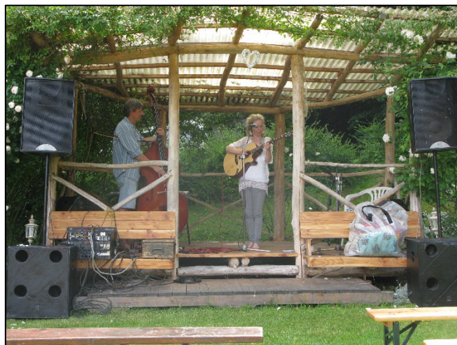
Z akce Chotěšovský slunovrat