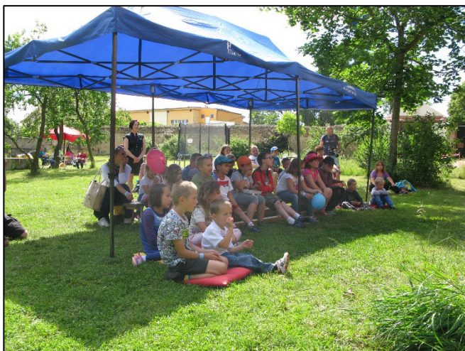
Z akce Chotěšovský slunovrat

Na závěr se ještě sluší říct, že i přes občasné přeháňky se počasí umoudřilo a za celý den se v areálu vystřídalo cca 500 lidí. Za hladký průběh celé akce se sluší poděkovat všem spolupořadatelům a dobrovolníkům a rovněž sponzorům, kteří na organizaci akce přispěli a bez jejichž příspěvku bychom nebyli schopni zajistit tak kvalitní a bohatý program. A teď už se můžeme těšit na příští rok, který chceme udělat zase o něco atraktivnější než ty předchozí.