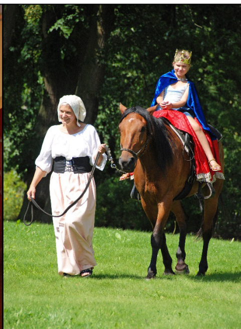
Z akce Baroko na bylinkovém panství Rochlov