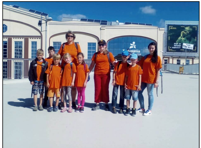
Z Animačního soustředění mladých historiků a techniků