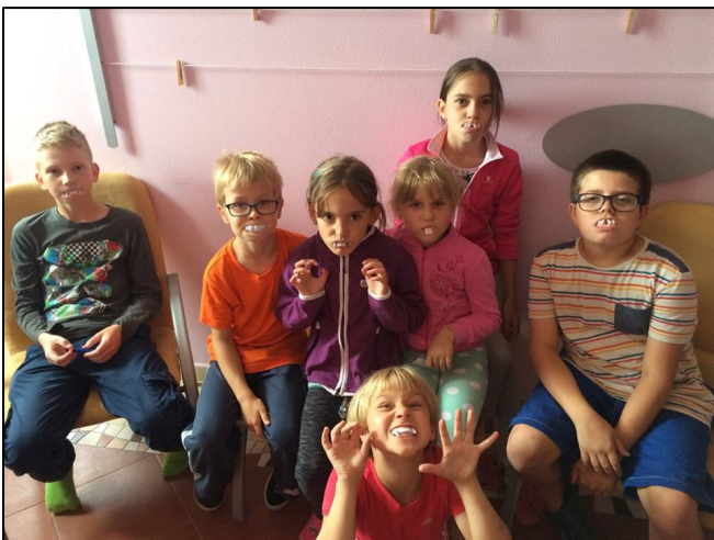
Z Animačního soustředění mladých historiků a techniků