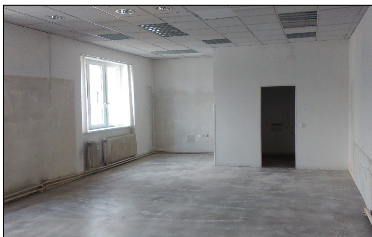
Prostory nové kanceláře před zahájením rekonstrukce