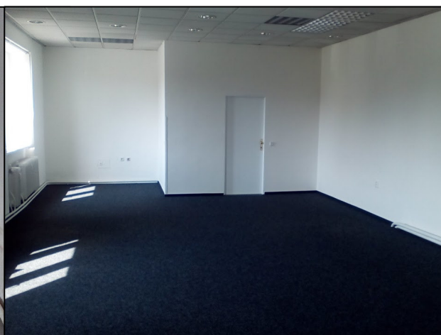
Z průběhu rekonstrukce