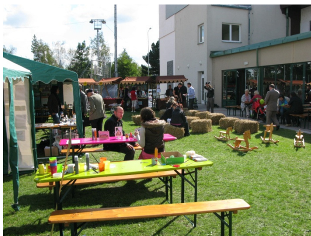
ITEP 2012 – výtvarné dílny pro děti

Prostřednictvím této výstavy byly představeny kulturní a turistické nabídky z regionů MASEk a navázalo se také na aktivity města Plzně – Evropského hlavního města kultury 2015. Pro malé i velké návštěvníky bylo připraveno mnoho zajímavých stanovišť. Mezi nejzajímavější patřil venkovský minijarmark, kde si mohli návštěvníci zakoupit umělecké předměty a potraviny z produkce místních řemeslníků a výrobců potravin. Děti pak hojně využívaly nejrůznější výtvarné dílny, ve kterých si mohly uplést proutěný košík, vyrobit kožedělné nebo keramické výrobky, vymodelovat z modelíny památku z území Plzeňského kraje podle fotografické předlohy. Dalo se rovněž „nakouknout do kraje“, „podívat se na sebe v přírodě“, „složit si výlet“, „podojit krávu“ a mnoha dalšími způsoby nahlédnout pod pokličku zajímavostí z území místních akčních skupin našeho kraje. V rámci prezentace aktivit naší MASy vystoupilo rovněž v kulturním bloku probíhajícím na pódiu v hlavní hale se svým tanečním vystoupením taneční studio Lions dance club z Města Touškov. Celá akce se setkala s velkým ohlasem a věříme, že podobně proběhne i další společná akce na jaře v Plzni ve Světovaru – Venkovské EXPO.