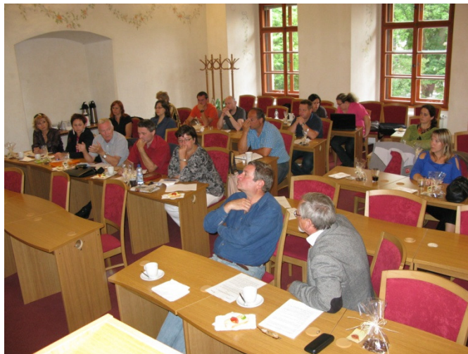
Z jednání KS MAS Plzeňského kraje v Klatovech

V závěru setkání se účastníci vydali na exkurzi do klatovské karafiátové zahrady a na nedalekou rozhlednu Bolfánek, kde mohli vidět příklady dobré praxe podpořených projektů z výzev od MAS Pošumaví.