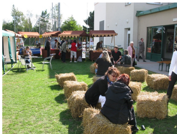
ITEP 2012 – venkovské posezení