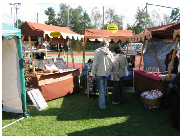
ITEP 2012 – venkovský minijarmark