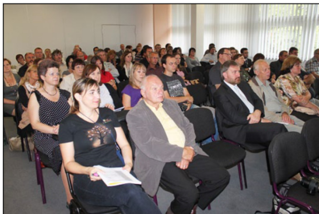
Seminář Podpora rozvoje... - ze Zpravodaje venkova 9/2012

Výstava byla rozdělena do jednotlivých oborových