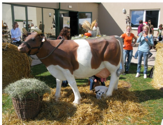
ITEP 2012 – „dojení krávy“

První akce v rámci projektu spolupráce se konala již 18.7.2012 na OÚ ve Svojšíně a jednalo se o seminář „Jak pořádat mezinárodní dobrovolnický tábor aneb workcampy zachraňují drobné památky“. Cílem semináře bylo představit zkušenosti se záchranou drobných památek v krajině za pomoci mladých dobrovolníků z různých koutů světa na Konstantinólázeňsku a sdílet zkušenosti ostatních účastníků semináře. Seminář byl otevřen široké veřejnosti a v jeho závěru proběhla krátká návštěva zámku ve Svojšíně, kde právě jeden takový workcamp probíhal.