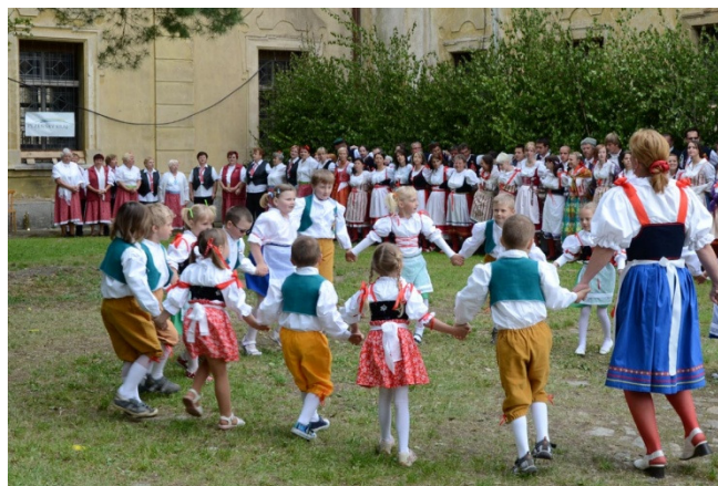
Staročeské máje – děti z MŠ