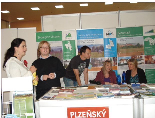
Na společném stánku MASEk Plzeňského kraje

dnů, v průběhu kterých se konaly jednotlivé tematické semináře, konference a besedy. Za MAS Radbuza jsme se zúčastnili semináře na téma „Podpora rozvoje venkova v ČR“, na kterém vystoupili zástupci ministerstva zemědělství, ministerstva pro místní rozvoj a NS MAS. Hlavními probíranými body semináře byla např. příprava a záměry MMR v oblasti rozvoje venkova v novém plánovacím období, stanovisko a názory na období 2014 - 2020 a jeho ukotvení v PRV, aktuální otázky rozvoje našeho venkova v evropském kontextu nebo téma propojování aktérů na venkově a jejich začleňování do směrů rozvoje venkova.