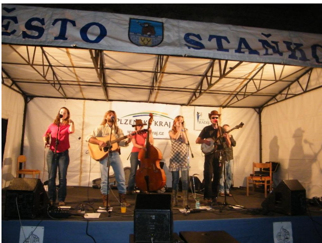
Folk – country festival

Žánr folk-country jsme si vybrali z důvodu velkého profesionálního i neprofesionálního zájmu této muziky v Plzni. Pozvali jsme skupiny převážně z Plzně: Spolucestující, Hynek Kočí, Alternativa, Růže v trní, Aftersix, The Rings, Duo My tři, Apple,