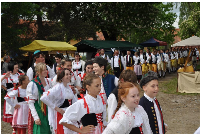
Staročeské máje – průvod

Ve dnech 12. a 13. května Spolek májovníků Chotěšov pořádal již XIX. Staročeské máje. Počasí bohužel nepřálo ani letos, ale to účastníkům nezabránilo dobře se pobavit, zazpívat si a zatancovat. Už minulý ročník organizátory překvapilo, kolik lidí a hlavně těch mladších má chuť si zatancovat a udržet dlouholetou tradici. A letos bylo ještě o dvě kolony dospělých a jednu kolonu dětí víc. Dohromady tak Českou besedu tancovalo patnáct kolon. Velkou radost dělají organizátorům hlavně májovnické děti. Některé začaly už jako malé, letos už z nich byli ti nejstarší a příští ročník snad