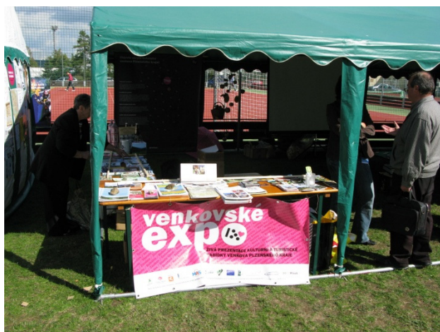
ITEP 2012 – informační stánek MASEk