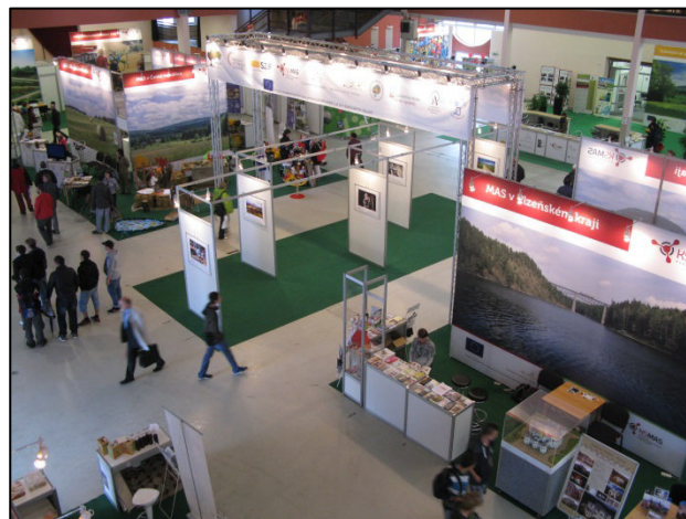
Expozice KS MAS z celé ČR v pavilonu Z