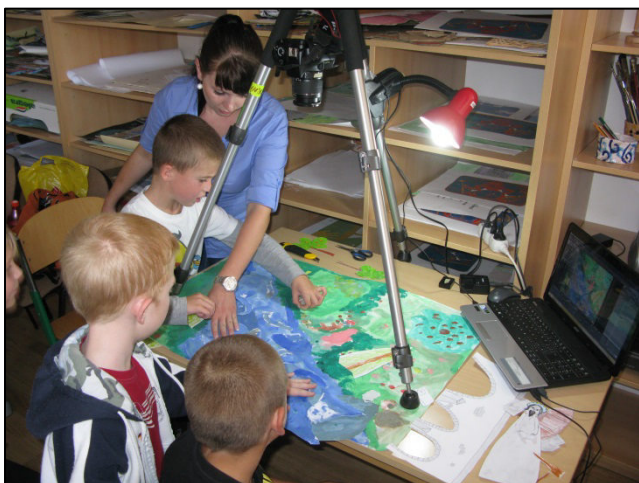
Děti při tvorbě filmu