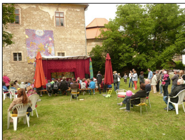
Z akce Chotěšovský slunovrat

I přes nepřízeň počasí si letos do kláštera našlo cestu více než 350 návštěvníků, kteří jistě nelitovali, že se akce zúčastnili. Budeme se těšit příští rok při dalším ročníku Chotěšovského slunovratu na viděnou.