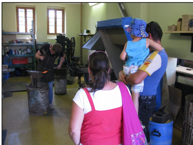
Z akce Rochlovské řemeslnění