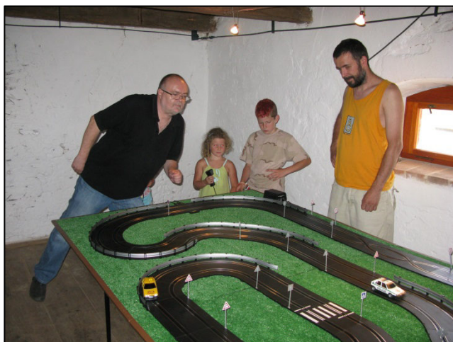
Z akce Rochlovské řemeslnění