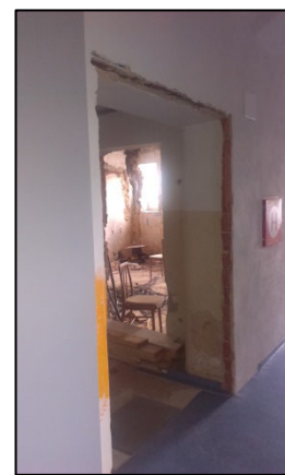
Vznikající expozice