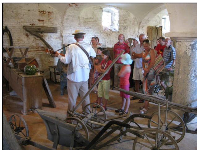
Z akce Rochlovské řemeslnění

Co by to ovšem bylo za řemeslnění, kdyby na něm chyběl řemeslný jarmark? Stánky s řemeslnými výrobky a místními produkty tak dokreslily atmosféru celé akce.