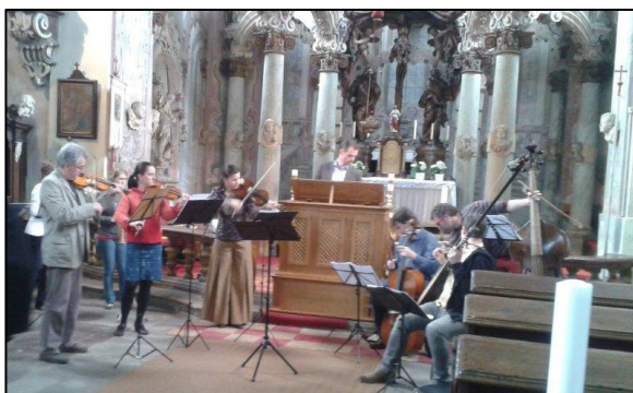
Z koncertu ve Vejprnicích

V letošním roce, kdy se realizovalo tzv. 6 týdnů baroka, byla bohužel naše oblast jednou ze tří, které finančně nepodpořila Plzeň 2015, nicméně na realizaci akcí posloužila zmiňovaná dotace z PK. V příštím roce, pro realizaci 9 týdnů baroka již máme příslib i od společnosti Plzeň 2015 na spolufinancování kulturních akcí realizovaných v rámci projektu.