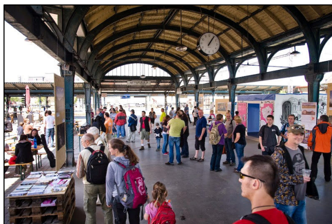
Z akce Venkovské miniEXPO

Fotografie z akce naleznete na adrese https://plus.google.com/u/0/photos/110781025921343002945/albums/6007812844578242241