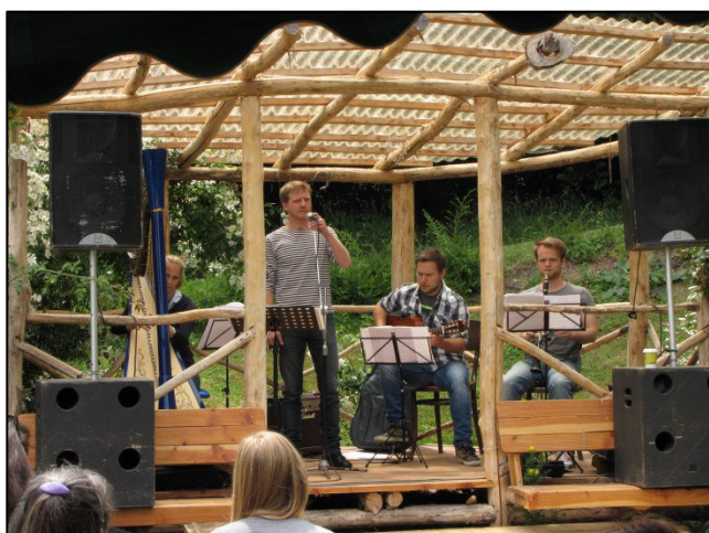
Z akce Chotěšovský slunovrat