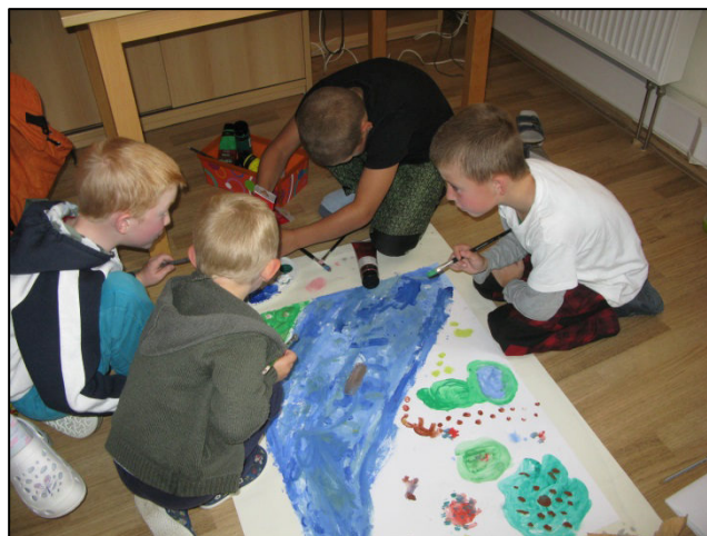
Děti při tvorbě filmu