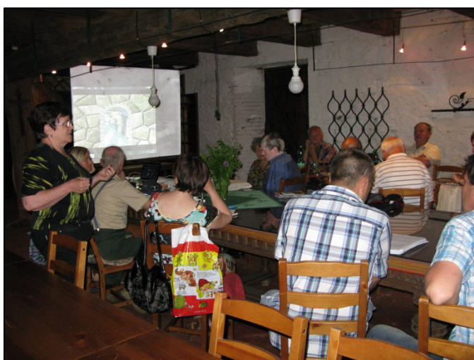
Z aktivu kronikářů na zámku Rochlov