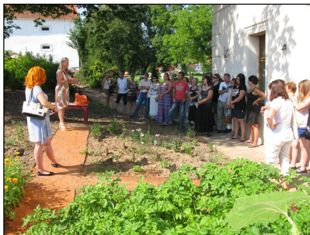
Z akce Rochlovské řemeslnění