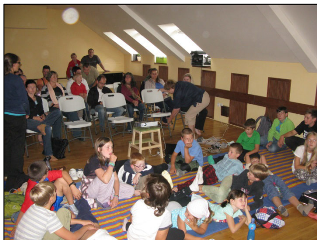
Závěrečná projekce filmů