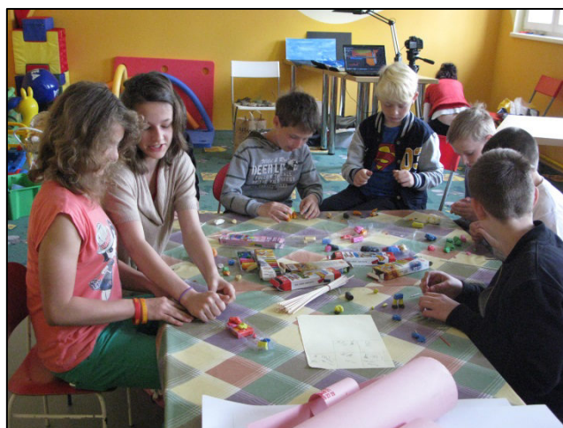
Děti při práci na animovaném filmu