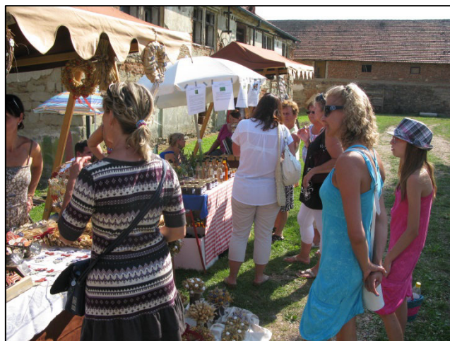
Z akce Rochlovské řemeslnění