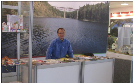
Stánek KS MAS PK na Zemi žitelce

I přes nepřítel počasí navštívily stánek KS MAS PK stovky návštěvníků. Součástí akce Země žitelka byl i bohatý doprovodný program, za zmínku stojí např. páteční seminář pořádaný Spolkem pro obnovu venkova na téma Podpora rozvoje venkova v ČR.