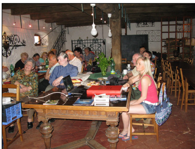
Z aktivu kronikářů na zámku Rochlov