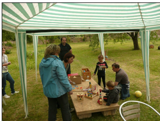
Z akce Chotěšovský slunovrat