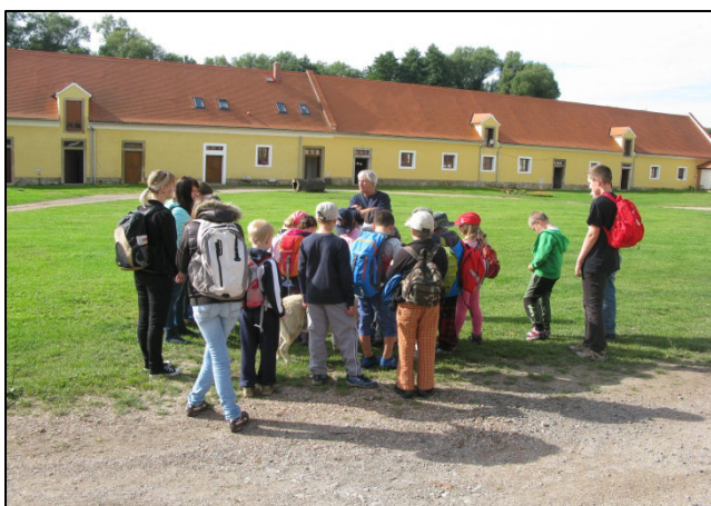
Z exkurze po památkách – dvůr Gigant