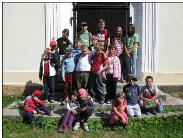
Z exkurze po památkách – Křížový vrch

Upravené verze filmů budou zveřejněny na youtube a odkaz na videa bude umístěn na webových stránkách MAS. Filmy by měly být rovněž zařazeny do soutěže Juniorfest a využívány v mateřských a některých základních školách v území MASEk zapojených do projektu.