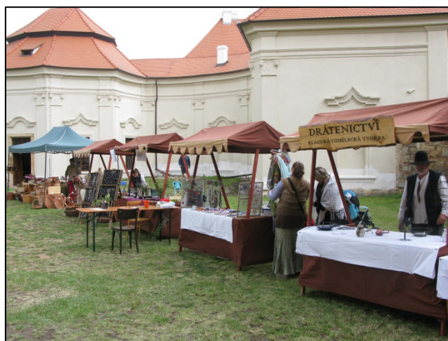
Z akce Chotěšovský slunovrat