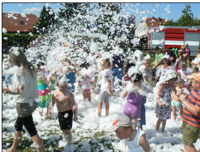
Z akce Hurá prázdniny v Chotěšově – Mantově