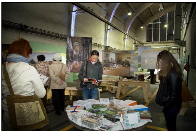
Z akce Venkovské EXPO