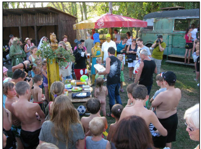
Z akce Rochlovské řemeslnění