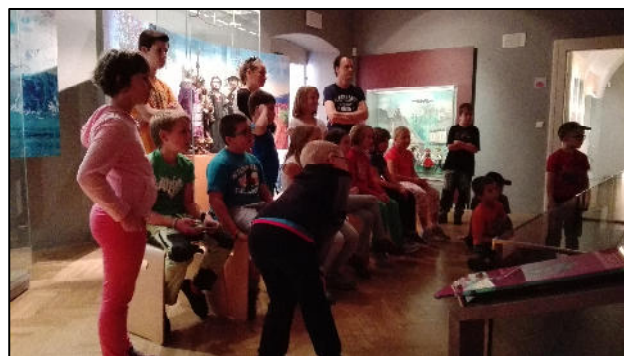
Z animačního soustředění – exkurze účastníků