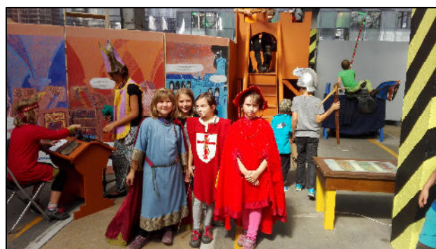
Z animačního soustředění – exkurze účastníků