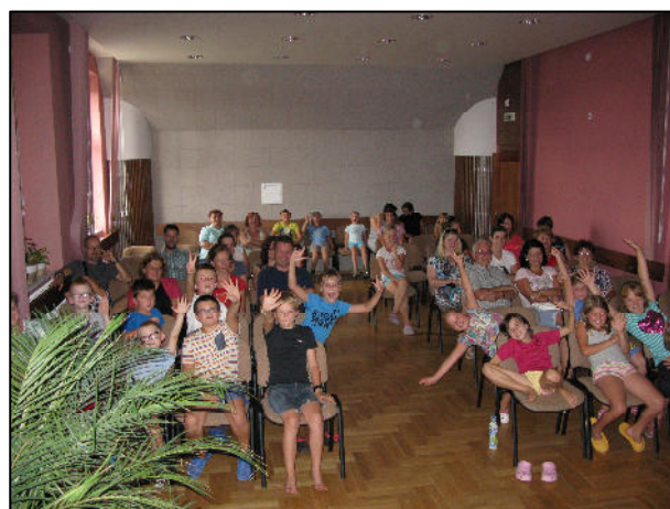
Z animačního soustředění – závěrečné promítání