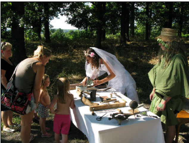
Z akce Rochlovské řemeslnění