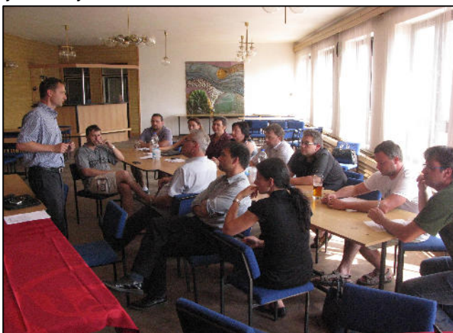
Ze setkání v Kozolupech

V průběhu jednání byly přítomným představeny dotazníky, které byly připraveny pro sběr projektových záměrů od jednotlivých subjektů v návaznosti na podporované aktivity z opatření jednotlivých operačních programů.