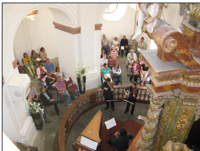
9 týdnů baroka - Dobřany