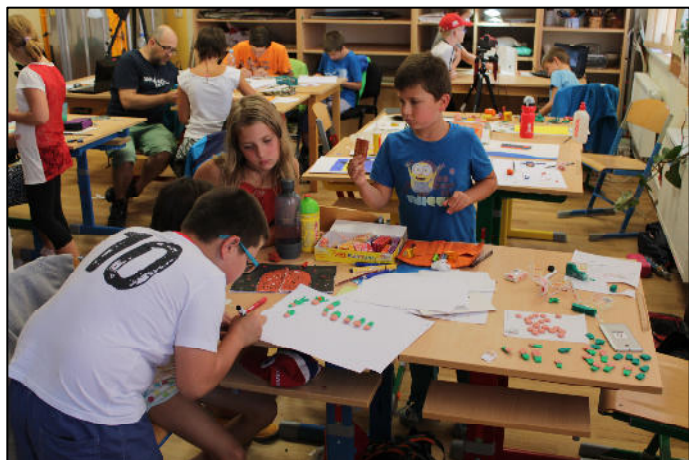
Z animačního soustředění – tvorba filmů

Od středy do pátku si pak již děti „vzali do parády“ zkušenosti animátorů z Animánie a začala samotná tvorba filmů. Jelikož více než polovina účastníků absolvovala i předchozí ročník, byla práce s technikou pro všechny mnohem jednodušší, neboť si ji mohli již dříve vyzkoušet. Mohli se tak věnovat více samotným scénářům jejich příběhů. Opět vznikla série 4 krátkých animovaných filmů, které byly v pracovní verzi promítány v pátek odpoledne rodičům dětí. Finální verze videí jsou umístěny na youtube, odkaz na videa naleznete na jiném místě Zpravodaje.