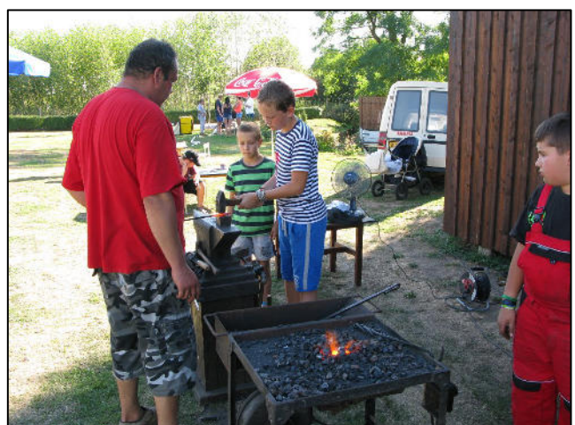
Z akce Rochlovské řemeslnění – kovářská dílna