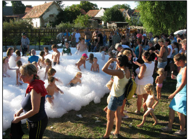
Z akce Rochlovské řemeslnění