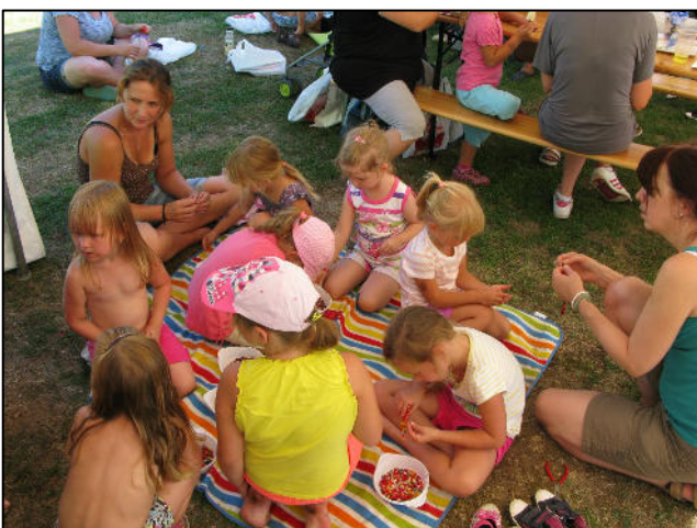
Z akce Rochlovské řemeslnění – korálková dílna