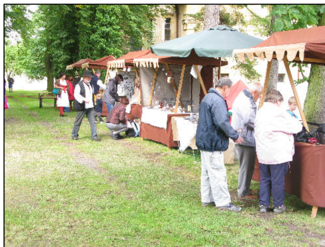
Z akce Chotěšovský slunovrat 2015

I díky dotaci Plzeňského kraje a příspěvku obce Chotěšov se na slunovratu objevili na folkové scéně takoví interpreti, jako Jiří Schmitzer a Spirituál kvintet. Ty doplnili další, již ostřílení účastníci této akce, která zdá se získává stále více na popularitě. Snad se nám podaří i v letošním roce připravit společně s ostatními místními spolky a obcí divácky atraktivní program.