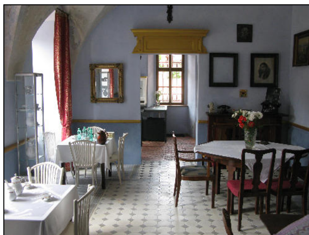
Karolinina kuchyně v Rochlově