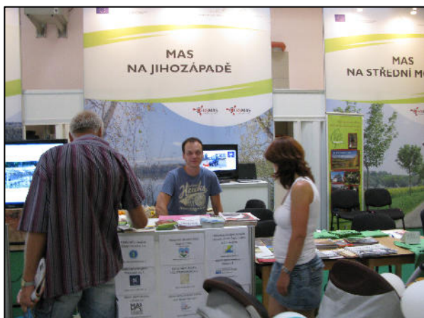
Země živitelka 2015

Stejně jako v předchozích letech i v roce 2015 se naše MAS na přelomu srpna a září účastnila veletrhu Země živitelka, na které pod hlavičkou NS MAS ČR prezentovala své aktivity na společném stánku plzeňských a jihočeských MAS. Je nutno podotknout, že velké množství MASEk nedávalo v roce 2015 významnou váhu této události, a tak byla akce celkově pojata výrazně minimalističtěji, než v předešlých letech. Pro letošní rok dojde pravděpodobně k úpravě celkové koncepce prezentace NS MAS ČR.