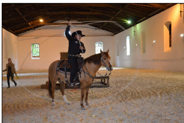
Ze slavnostního otevření jízdárny