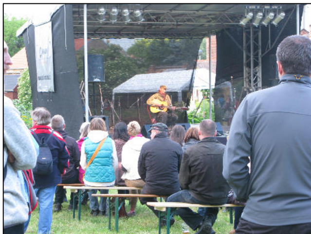
Jiří Schmitzer