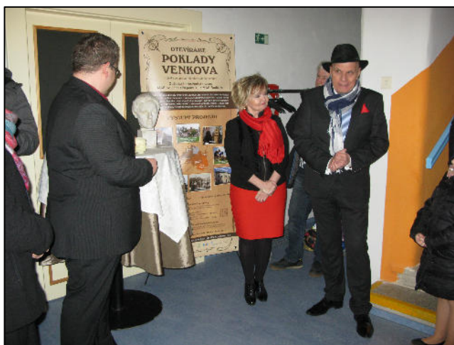
Ze slavnostního otevření expozice

Poslední projektem spolupráce, který MAS realizovala, byl projekt Výměna zkušeností mezi MAS Plzeňského a Karlovarského kraje. Tento projekt byl zaměřen především na podporu provozu jednotlivých MAS v „překlenovacím období“. Každý projekt spolupráce v této výzvě ovšem musel mít jako povinný výstup metodiku zaměřenou na jedno ze tří předem stanovených témat. Naše MAS ve spolupráci s dalšími MASKami PK a KK zpracovala metodiku na téma „Evaluace a monitoring strategie MAS“. Metodika je umístěna na webu MAS http://www.mas-radbuza.cz/projekty-mas/prv-iv21/vymena-zkusenosti-mezi-mas-pk-a-kk/ .