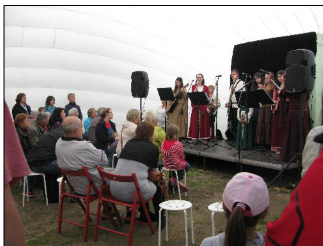
Z akce Chotěšovský slunovrat 2015