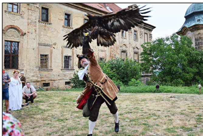
9 týdnů baroka - Chotěšov