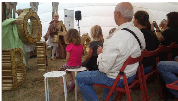
9 týdnů baroka – Rochlov