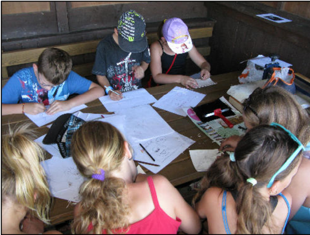
Z akce Rochlovské řemeslnění – dílna linorytu

V roce 2014 se uskutečnil první ročník akce Rochlovské řemeslnění a to v prostorech zámku. V roce 2015 byl program kulturních akcí na zámku omezen, proto MAS, která na realizaci akce získala dotaci od Plzeňského kraje, dlouho zvažovala, jakou formou akci zrealizuje. Nakonec došlo k domluvě s obcí Rochlov, která na stejný termín chystala akci pro děti. MAS Radbuza v rámci této společné akce zajistila řemeslné dílny, na kterých si mohli návštěvníci, a to především ti nejmladší, vyzkoušet řemeslo kovářské, linorytecké a šperkařské, které pro nejmenší děti přichystalo korálkovou dílničku. Malí návštěvníci, kteří právě nebyli na trase závodu, v hojném počtu obsadili jednotlivé dílny. Aby toho řemesla nebylo málo, jedna ze zastávek trasy závodu představovala poznávací soutěž starých nástrojů a přístrojů.