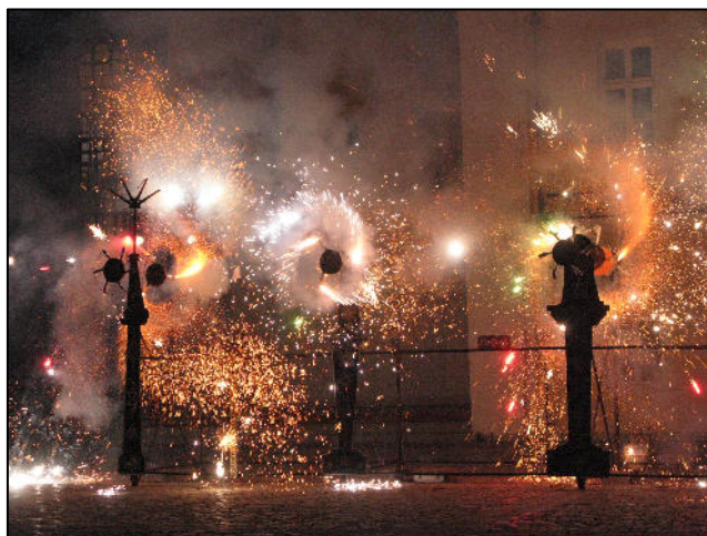
9 týdnů baroka – Dobřany

V rámci udržitelnosti projektu se plánuje program 9 týdnů baroka i pro letošní rok.