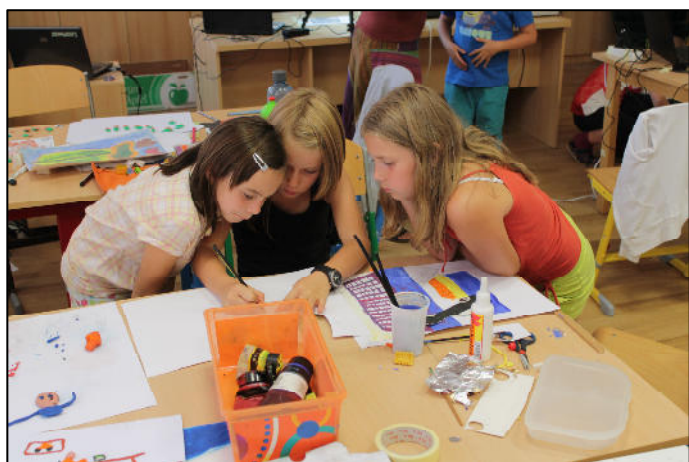
Z animačního soustředění – tvorba filmů