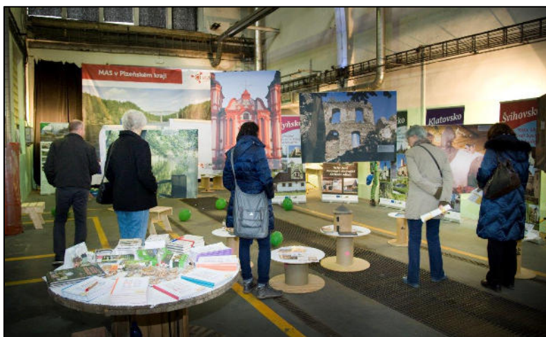
Z akce Venkovské EXPO