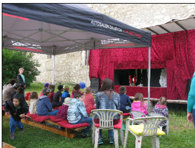
Z akce Chotěšovský slunovrat 2015