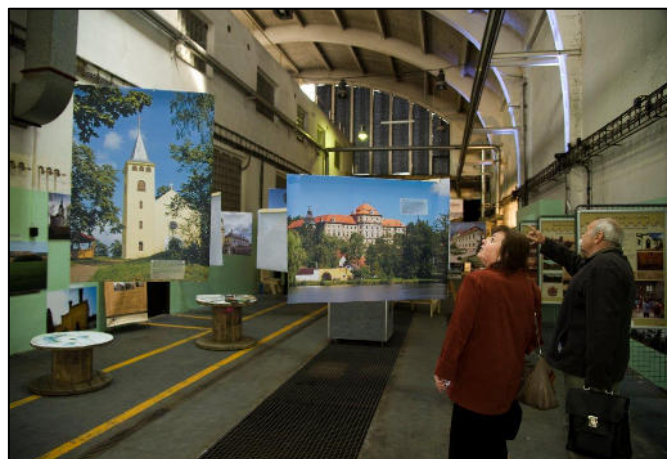
Z akce Venkovské EXPO