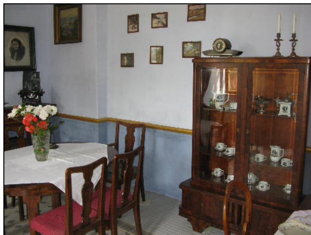
Karolinina kuchyně v Rochlově