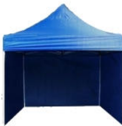
Typové provedení párty stanu