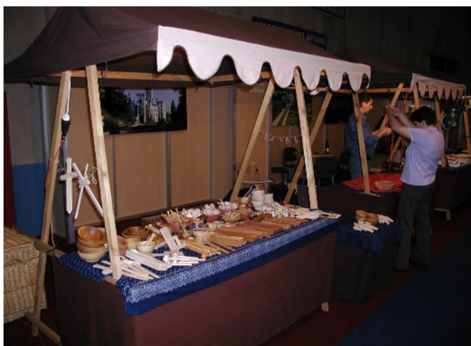
Typové provedení jarmarečního stánku

V roce 2015 pak obdržela MAS Radbuza dotaci od Plzeňského kraje na Činnost a chod MAS 2015. V rámci této dotace, která byla poskytnuta ve výši 100 tisíc korun, může MAS Radbuza nakoupit kancelářské vybavení, které dosud nebylo v krajské dotaci způsobilým výdajem. Došlo tak již k nákupu kvalitní multifunkční tiskárny (doposud MAS nevlastnila tiskárnu), v jarních měsících dojde k nákupu dataprojektoru, který ve výbavě MAS také dosud chybí.