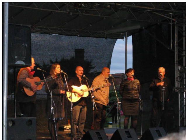
Spirituál kvintet

Videa z videomappingu jsou umístěna např. na serveru youtube. Z akce Večer pro klášter Chotěšov, kde byl promítán stejný program, je např. zde https://www.youtube.com/watch?v=h6jE2BM9Z24 (autor Rudi Klier).