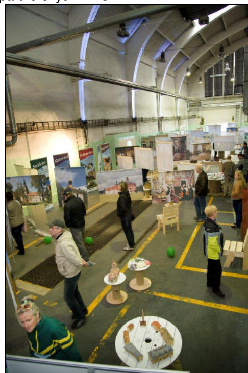
Z akce Venkovské EXPO

Celá akce se konala v návaznosti na projekt spolupráce Skrytá bohatství venkov Plzně, v rámci jehož udržitelnosti se do organizace akce zapojilo sedm partnerských MAS z PK.