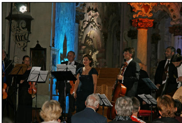
9 týdnů baroka – Vejprnice