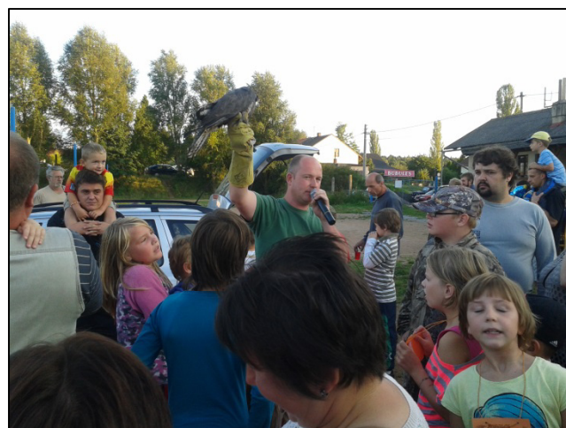
Z akce Bubules