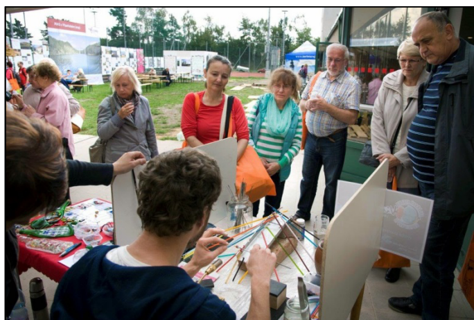
Z akce ITEP 2014