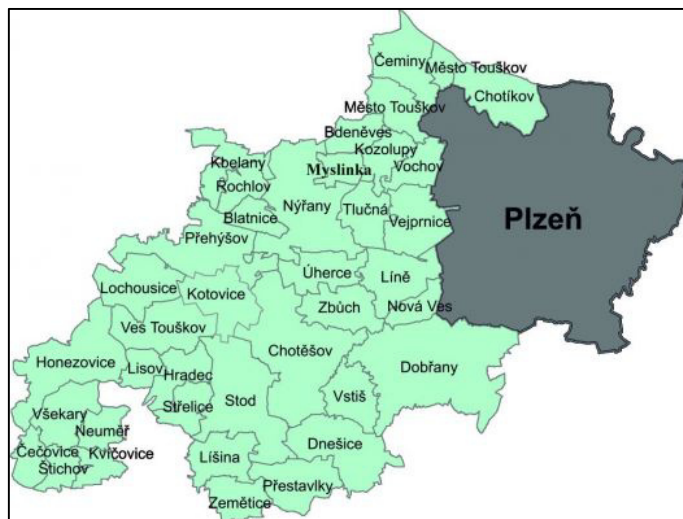
Zájmové území MAS Radbuza k 31.12.2014

Tímto krokem došlo k definitivnímu vymezení zájmového území MAS Radbuza pro programové období 2014 - 2020, neboť obec Myslinka byla posledním pomyslným bílým místem na mapě.