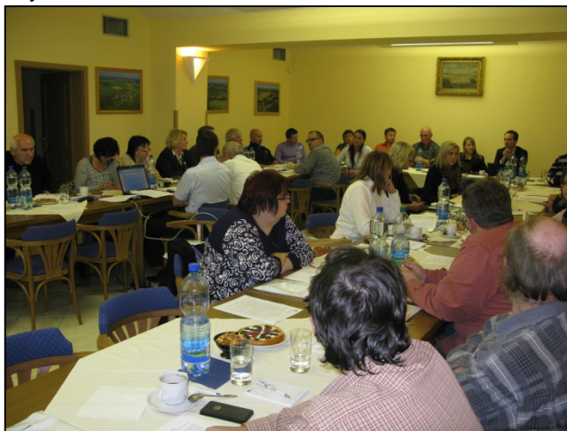
Z jednání VH MAS Radbuza

VH následně schválila plán činností a rozpočet na rok 2015, pravidla a vyhlášení GDP, prodloužení čerpání úvěru u ČS, a.s. a rozšíření zájmového území o obec Myslinka.