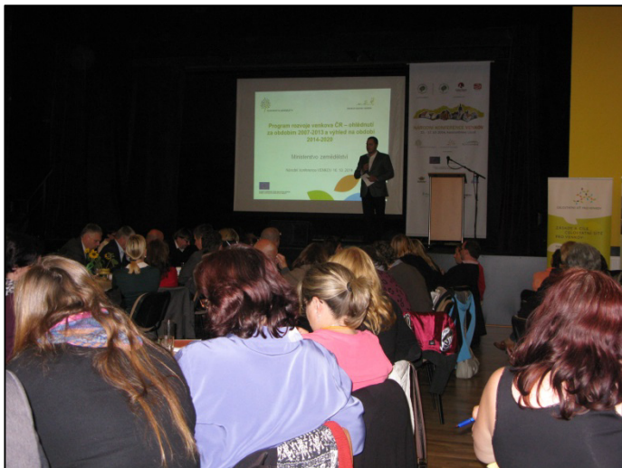
Z konference Venkov 2014