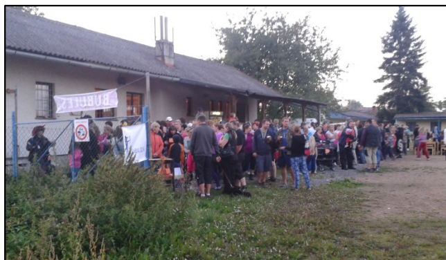
Z akce Bubules

Když se konečně setmělo, smělo se konečně vyrazit na trať, která jako obvykle začínala na hrázi rybníka.