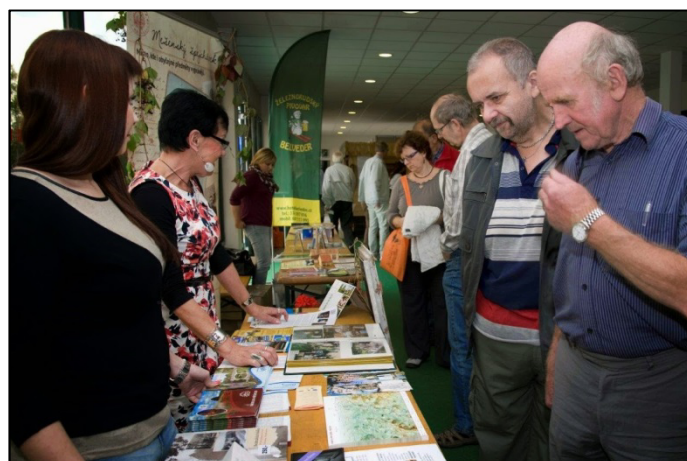
Z akce ITEP 2014