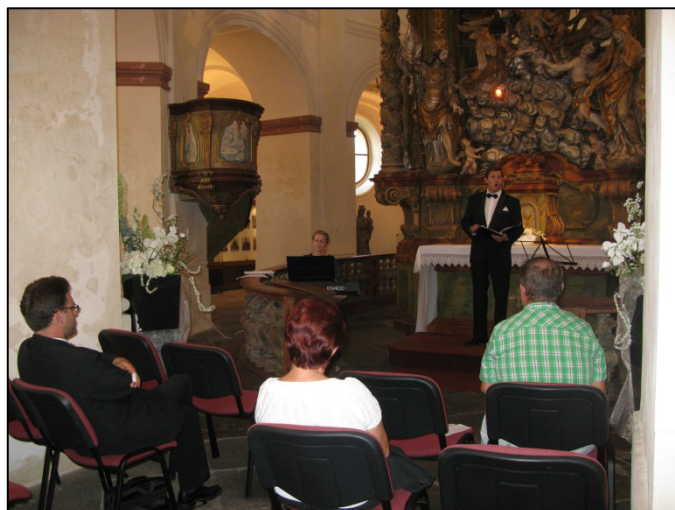
Z koncertu v kostele sv. Víta v Dobřanech

V letošním roce proběhne v rámci programu 9 týdnů baroka opět koncert barokní hudby, tentokrát však s jiným uměleckým obsazením a obohacením o gurmánský zážitek.