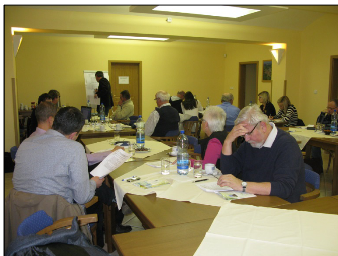
Z Konference pracovních skupin a veřejnosti