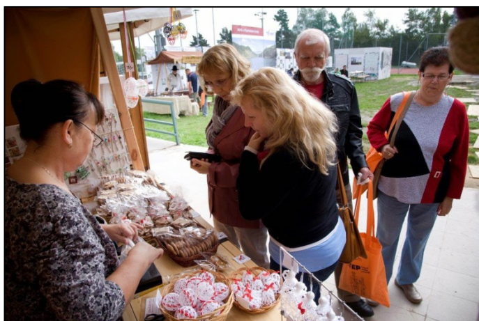
Z akce ITEP 2014

V rámci expozice MASEk byly prezentovány zajímavé historické a kulturní památky v regionu, které byly vystaveny především ve venkovních prostorách sportovní haly. Pro návštěvníky byly připraveny informační materiály, brožurky a fotodokumentace jednotlivých obcí v zájmových územích. Pro malé návštěvníky byla připravena řada zábavných aktivit např. „slož si výlet“ či expozice, nabízející ty nejkrásnější pohledy na území MAS Radbuza, které si děti mohly libovolně vybarvit. V rámci venkovní expozice mohli účastníci shlédnout také tvorbu skleněných výrobků, popř. si i nějaký skleněný výrobek zakoupit. Ve venkovních prostorách měli své stánky také místní řemeslníci, kteří prodávali své výrobky. Ve vnitřních prostorách sportovní haly se nacházela velmi zajímavá prezentace úsilí p. Marie Musilové a MAS Aktivios, díky kterému vzniklo nejmenší muzeum v České republice s názvem „mešenský špejchárek“. Miniexpozice se nachází na jihu Rokycan a je věnována předmětům, které bývaly kdysi běžnou součástí života.