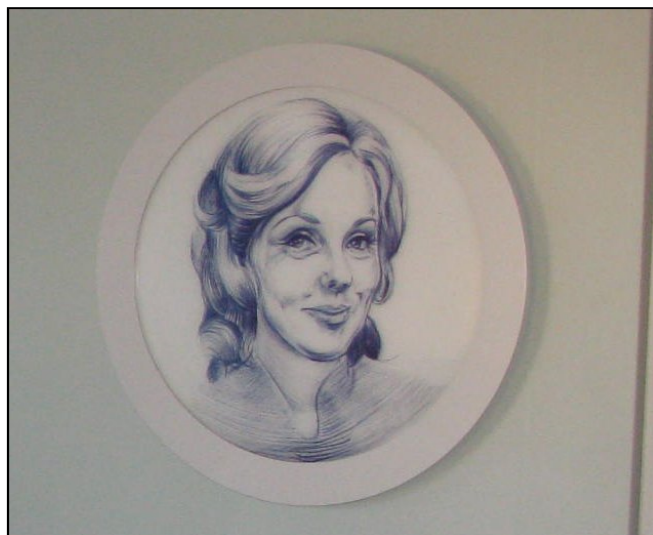
Z interiéru nově budované expozice

Kapacita akce je omezená, rezervace provádějte prostřednictvím emailu na adrese info@mas-radbuza.cz .