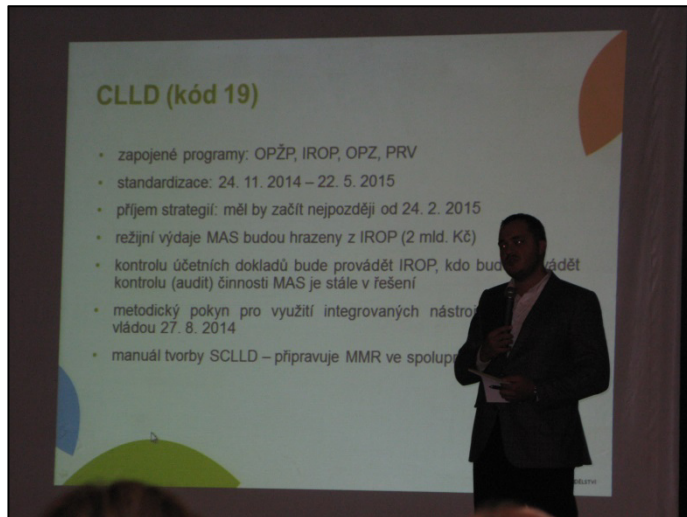
Z konference Venkov 2014