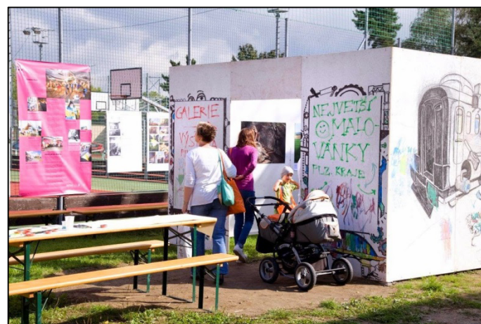
Z akce ITEP 2014

Více fotografií na: https://plus.google.com/photos/110781025921343002945/albums/6067184782588424049