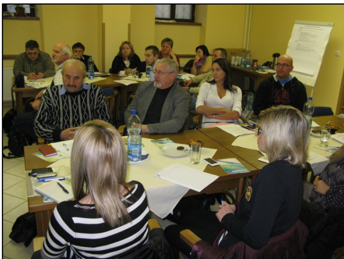
Z Konference pracovních skupin a veřejnosti

MAS Radbuza by ráda poděkovala všem zúčastněným za jejich čas a hlavně za ochotu účastnit se přípravy strategie MAS. Díky pracovním skupinám byly definovány potřeby a problémy v jednotlivých zmiňovaných oblastech.