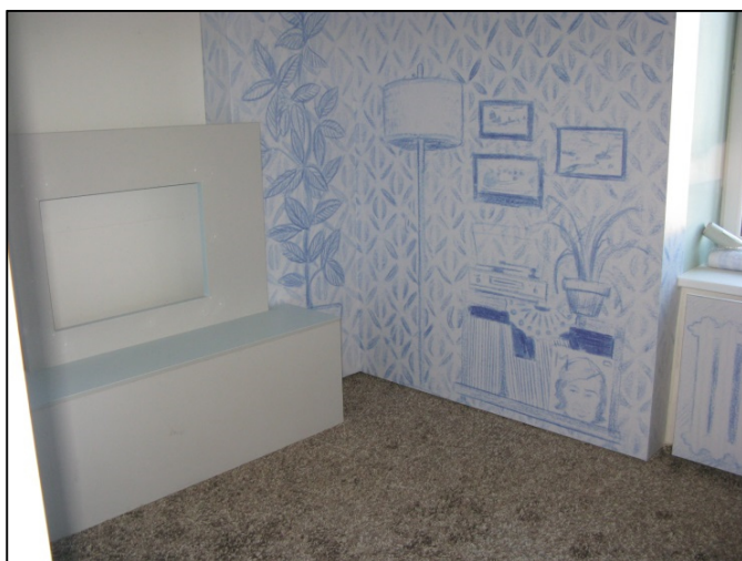
Z interiéru nově budované expozice