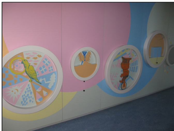
Z interiéru nově budované expozice