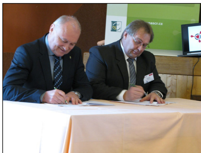
Podpis memoranda o spolupráci s rektorem JČU