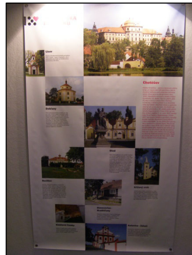
Panel MAS Radbuza – foto R. Hrdlička