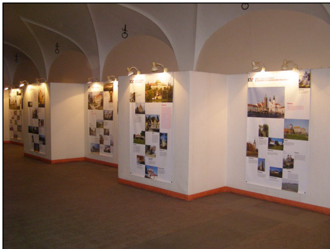
Z výstavy v mázhauzu radnice v Plzni – foto Rudolf Hrdlička

Celá prezentace byla zaměřena na spolupráci MASEk PK a Plzně 2015 v rámci aktivit k titulu Plzeň – Evropské hlavní město kultury 2015. Každá MAS měla k dispozici prostor pro vlastní prezentaci míst v území s barokním potenciálem, několik panelů bylo zaměřených na společnou prezentaci s Plzní 2015. Tyto panely by měly být využitelné i při dalších příležitostech, např. v rámci putovních výstav. Elektronická verze prezentace je přístupná na adrese http://issuu.com/venkovplzni/docs/vystava-venkov-plzni-leden-2014 .