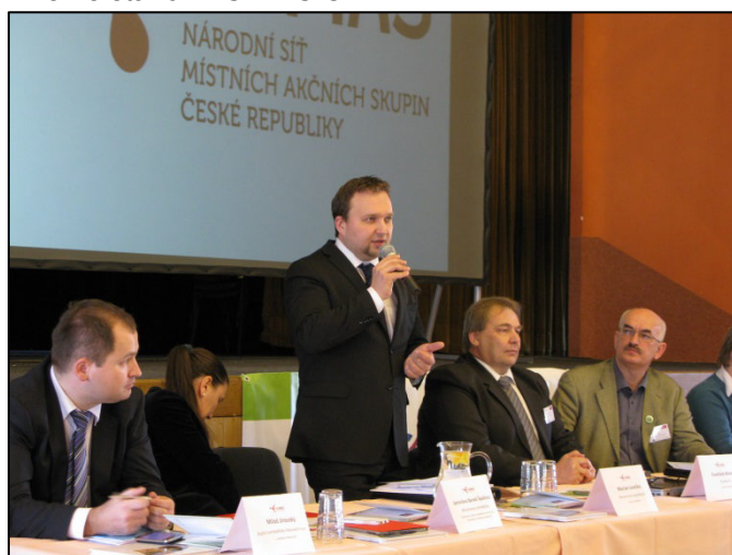
Ministr zemědělství poprvé na jednání VH NS MAS ČR