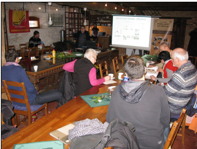
Z průběhu workshopu – přednáška lektora

Poslední ze série workshopů se bude konat ve Špejcharu v Chocenickém Újezdu dne 26.4.2014 od 10:00h. Workshop bude určen především pro realizátory expozic, další zájemce o historii a místopis a zpracování těchto dat. Workshop se zaměří na budování nových expozic. Předpokládaný časový rozsah workshopu je 5 hodin, součástí bude též metodické vedení ke zpracování libreta. Cílem této akce je metodická pomoc s přípravou expozic, přes jejich návrh až k úspěšné realizaci expozic, též se zapojením interaktivních prvků, včetně uskutečnění akcí. Workshop se zaměří na expozice věnující se přírodě, místopisu a historii. Organizátorem posledního workshopu je OS Aktivios, který zároveň eviduje přihlášky účastníků.