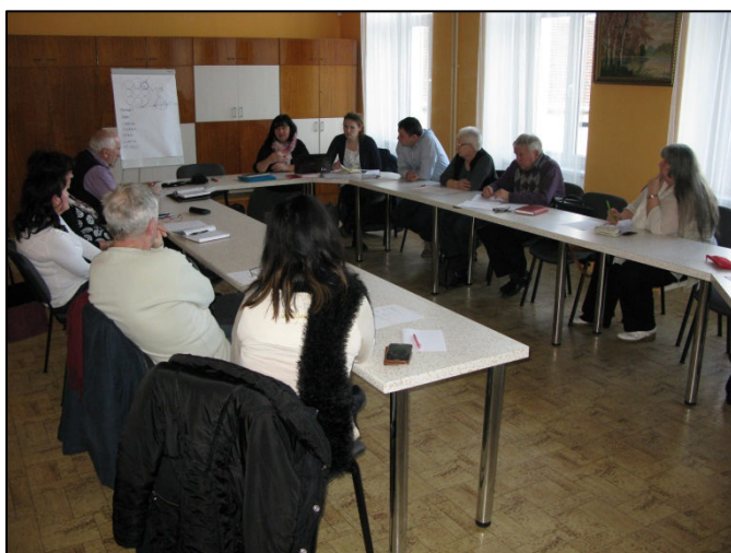
Z pracovních schůzek se zástupci lokálních partnerů