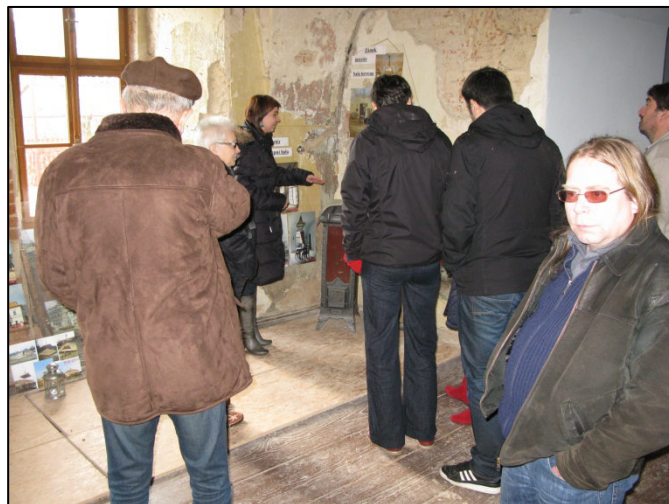
Prohlídka zámeckých prostor