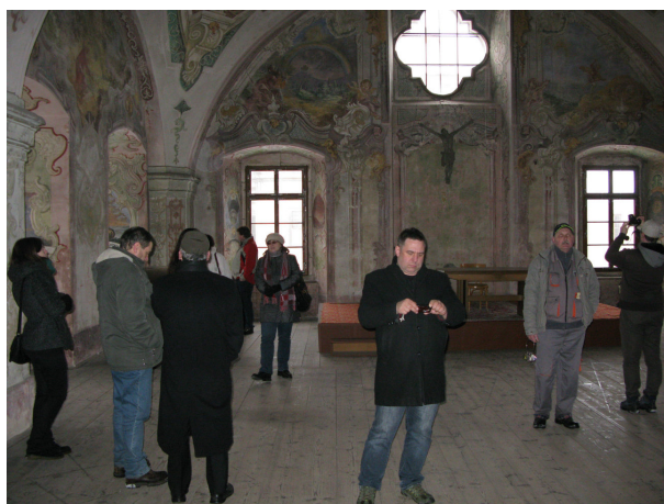
Prohlídka kláštera v Chotěšově