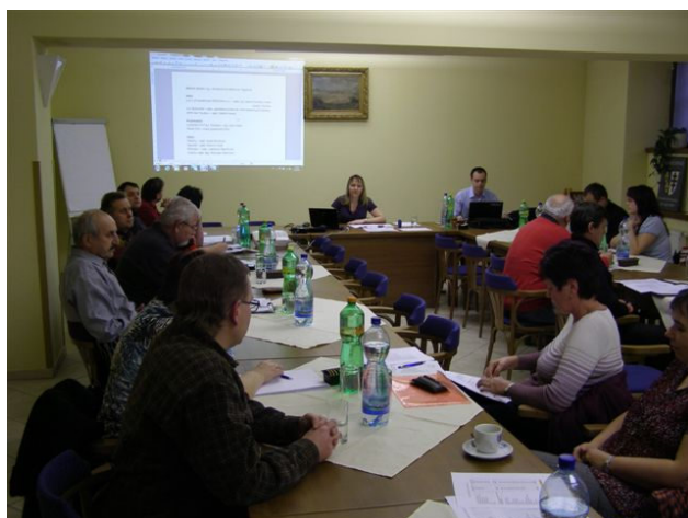
Z jednání VH MAS Radbuza v Dobřanech

Dne 5.2.2013 se v zasedací místnosti MěÚ v Dobřanech konalo letošní první jednání Valné hromady MAS Radbuza. Přítomných bylo celkem 24 členů nebo zplnomocněných zástupců MAS Radbuza z celkového počtu 36. V rámci programu jednání byl mimo jiné předložen návrh úpravy Stanov sdružení. Vzhledem k dřívější rezignaci jednoho z členů VR a zároveň k zajištění větší transparentnosti byla navržena Výkonnou radou úprava klauzule týkající se stálých a volených členů sdružení a několik dalších drobných úprav. V nové verzi stanov již není obsažena klauzule o stálých členech VR.