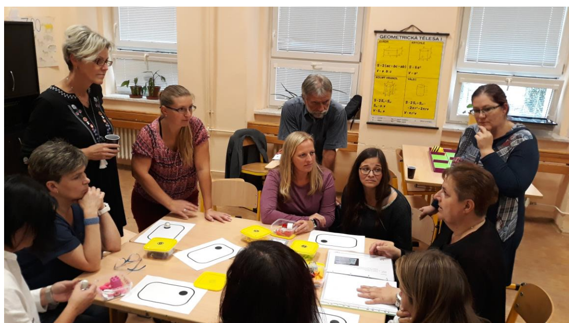
PS Matematická gramotnost