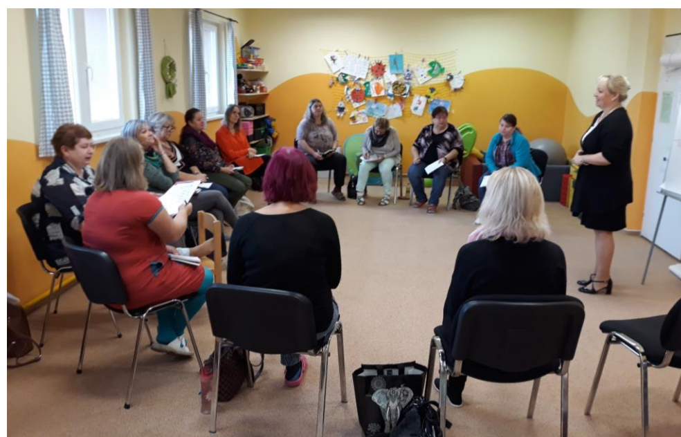
PS Rovné příležitosti