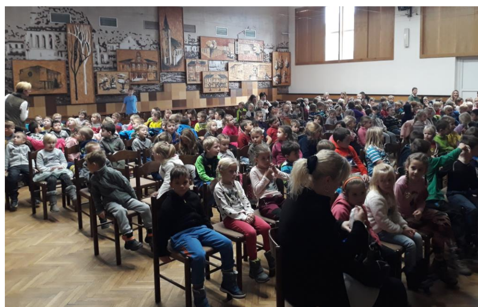
Výchovný koncert ZUŠ Nýřany