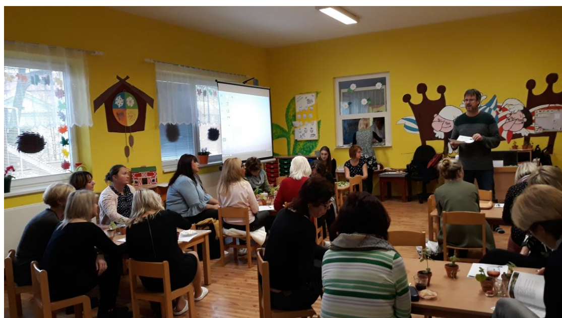
Setkání ředitelky MŠ

Teď se můžeme i my na MAPEch těšit na zklidnění a pohodu Vánoc, abychom zas v plné síle v roce 2020 mohli přijít s dalšími zajímavými nabídkami, kterých již teď máme spoustu ve fázi plánu a připrav....těšte se spolu s námi!