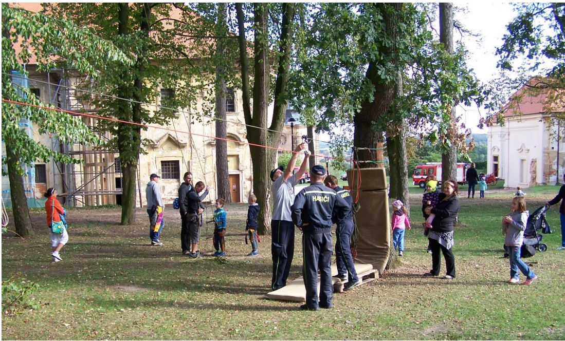
Lanové překážky v parku s asistencí SDH Chotěšov

praku a dětského koutku, pro větší děti závodní simulátory, lanové překážky. V gotických sklepeních se odehrávala živá expozice strašidelného sklepa, k dispozici byl i skákací hrad a možnost se svést na koních. Ve vnitřních prostorách konventu byly promítnuty filmy pro děti a v podvečerních hodinách i pro dospělé.