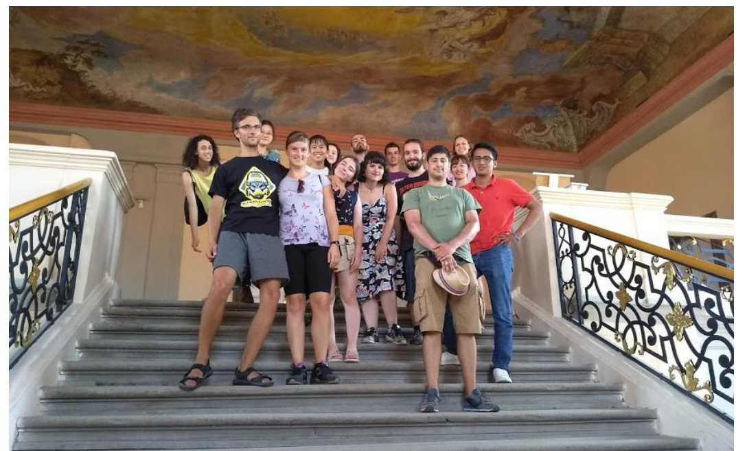
„Kolegové“ z workcampu 2019