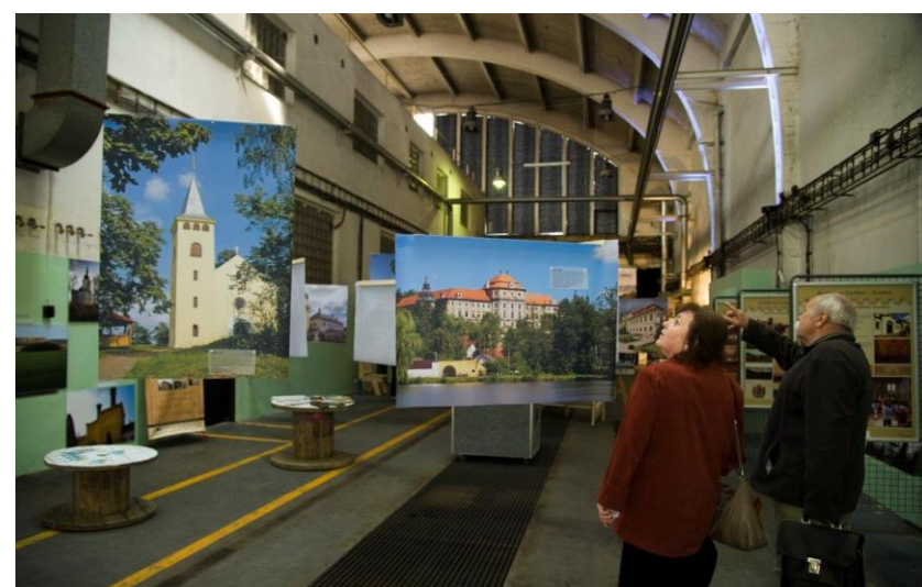
Spolupráce MAS, DEPO2015 a nově vzniklého Venkovského domu PK je vždy spolehlivou kombinací pro zajímavé akce a podporu venkova (nejen) v našem území