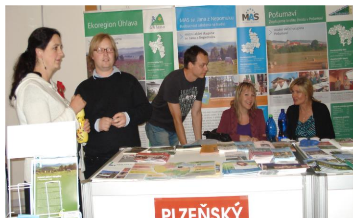
Společná prezentace MAS PK na Zemi živilce 2013

Vážení čtenáři, v březnu tohoto roku oslavila MAS Radbuza významné výročí – 10 let od vzniku organizace. To už je pro neziskovku docela dlouhá doba existence a jistě stojí za to připomenout si některé zajímavé milníky z dosavadního života naší MASky. Bohužel jsme kvůli pandemii Covid-19 nemohli tento významný den oslavit s vámi všemi, našimi partnery a přáteli, tak, jak jsme původně plánovali. Chystali jsme pro vás reprezentační ples, který jsme si s vámi chtěli společně příjemně užít. Museli jsme jej ale nakonec zrušit a nyní přemýšlíme, jakou náhradní variantu připravit, abychom alespoň dodatečně mohli tuto událost oslavit. Nyní uvažujeme o variantě letní slavnosti v prázdninových měsících, a pokud ani ta nakonec nevyjde, budeme doufat, že reprezentační ples budeme moci uspořádat na podzim letošního roku.