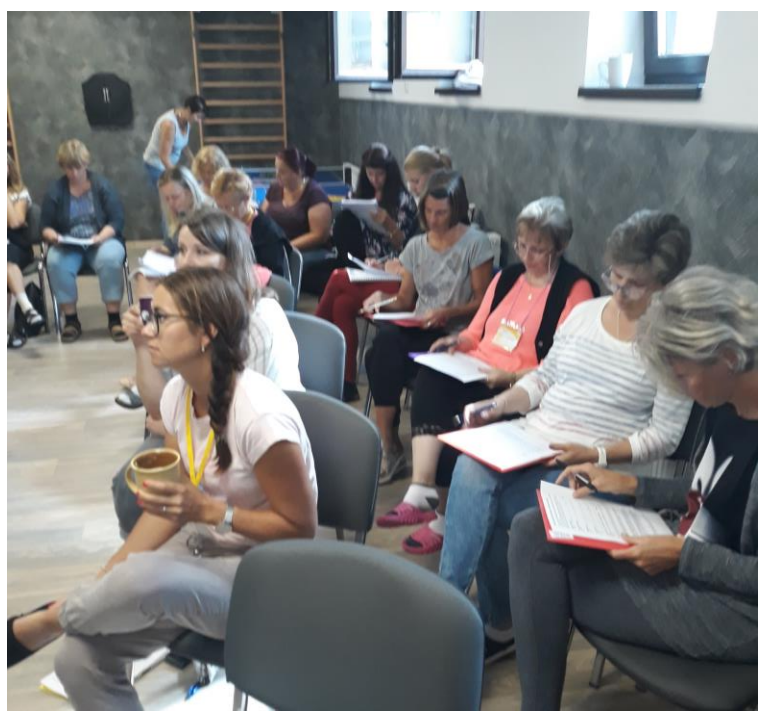
Letní škola 2020

S příchodem nového roku se situace nijak nezměnila ani v rámci realizace MAPů, žijeme a pracujeme především v on-line prostředí. Je třeba ocenit, že většina lektorů připravuje kvalitní webináře v potřebných tématech, stále je však patrná touha po návratu k prezenčním setkáním. Tak snad se brzy dočkáme!