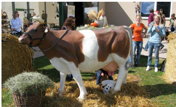
Veletrh cestovního ruchu ITEP 2012

tehdy ještě jako občanské sdružení. S obcemi nejen z Mikroregionu Radbuza, ale i s dalšími (od mikroregionu na sever) stanovili zájmové území MAS. I když u některých obcí byla zpočátku cítit jistá nedůvěra ve vznik naší MASky a její přínos pro území, což bylo dáno především neznalostí fungování MASek jako takových, nakonec se podařilo stanovit zájmové území téměř 40 měst a obcí, které pokrylo bílé místo mezi okolními existujícími MAS. Zcela zásadní byla pro rozjezd MASky bezesporu finanční podpora měst a obcí. A to nejen těch, které se staly členy a platily členské příspěvky, ale všech obcí zájmového území, které ochotně přispívaly na činnost MAS několik prvních roků existence, než se dostala do nového programového období (2014-2020) a získala dostatečné prostředky na zajištění provozních aktivit z evropských dotací. Za to všem těmto obcím patří velký dík. Bez podpory tehdejších starostů a starostek by se MAS Radbuza asi nikdy nemohla naplno rozjet!