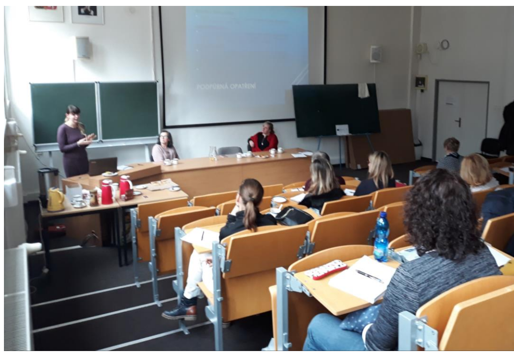
PS Rovné příležitosti – setkání s PPP

Bohužel, s ohledem na nařízení vlády jsme byli nuceni zrušit konání všech naplánovaných seminářů, dokud se situace ohledně rizika šíření nákazy koronavirem nevyřeší. Momentálně jsme tak museli „uspat“ nejbližší semináře – výběrem např. setkání Pracovní skupiny Financování, tentokrát spojené se seminářem „Nejčastější chyby“ určeném pro účetní škol a příspěvkových organizací a dále pak seminář „Praktická práce s Klokanovými kufry“ (již proběhly semináře na téma „Diagnostika dětí v MŠ“ v základní i verzi pro pokročilé). Je nám velice líto, že jsme museli zrušit i oblíbená setkání ředitelů a ředitelky mateřských a základních škol, ale věříme, že se nám pro ně brzy podaří najít náhradní termín, stejně tak jako termín pro exkurzi do ZŠ v Ústí nad Labem, návštěvu ve speciálních třídách v ZŠ a MŠ Město Touškov, semináře pro rodiče a v neposlední řadě i pro vzájemné návštěvy pedagogů mateřských škol. Věříme v lepší zítřky a už se opět těšíme na naše společná setkání.