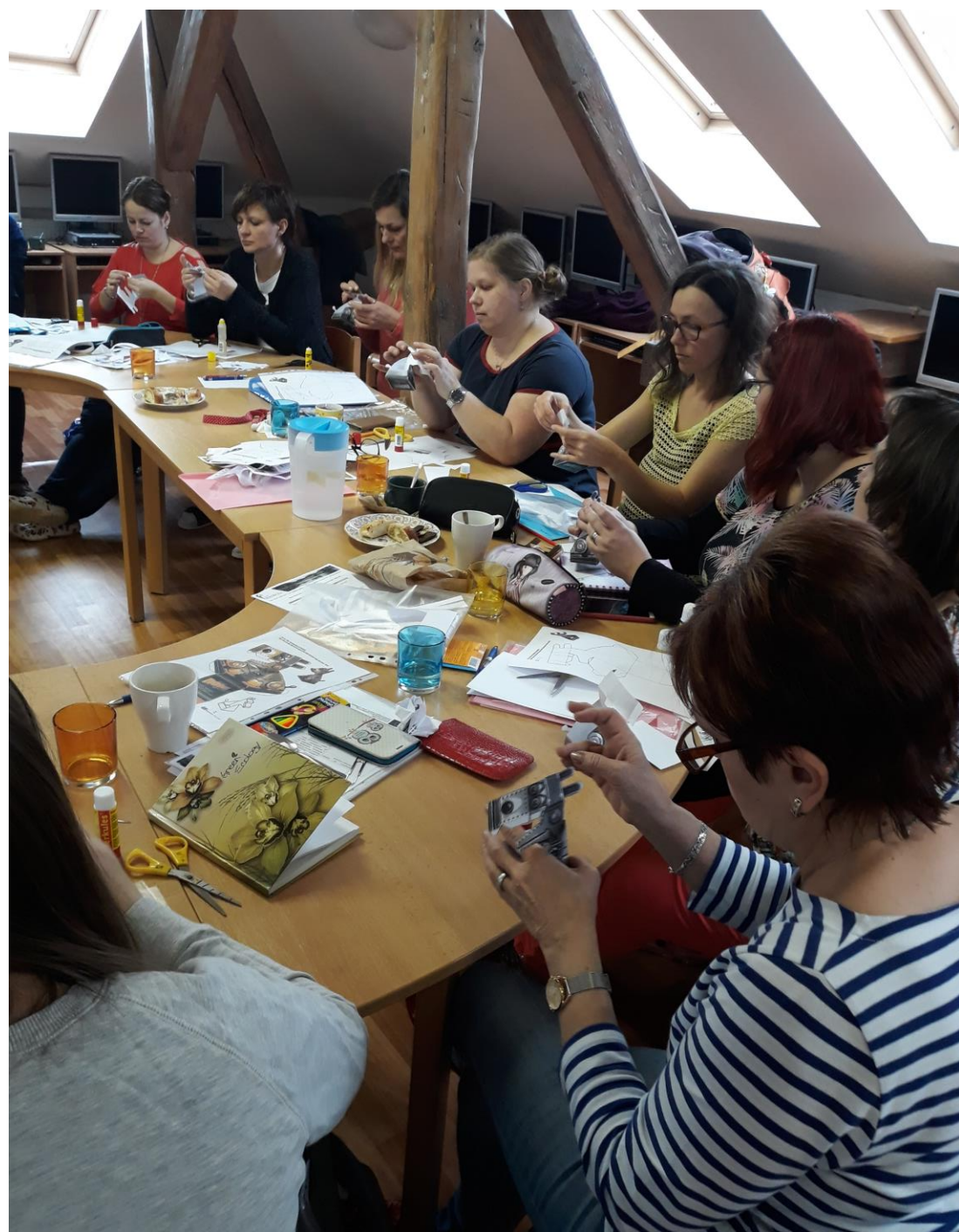
PS Matematická gramotnost – „Bádáme a přemýšlíme hrou“