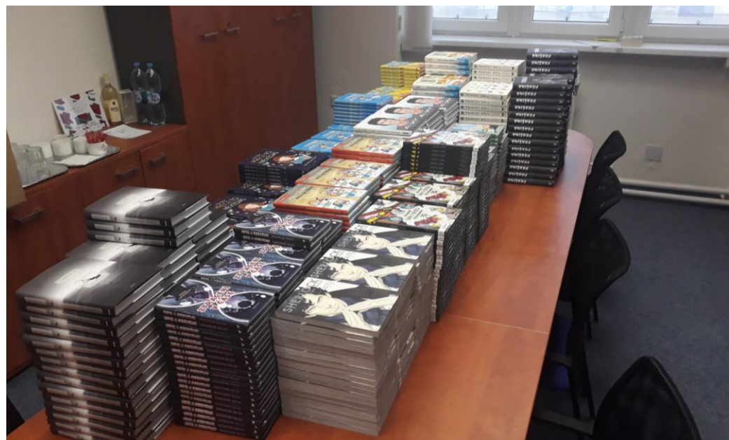
Knihy do projektu Čtení - nejlepší učení