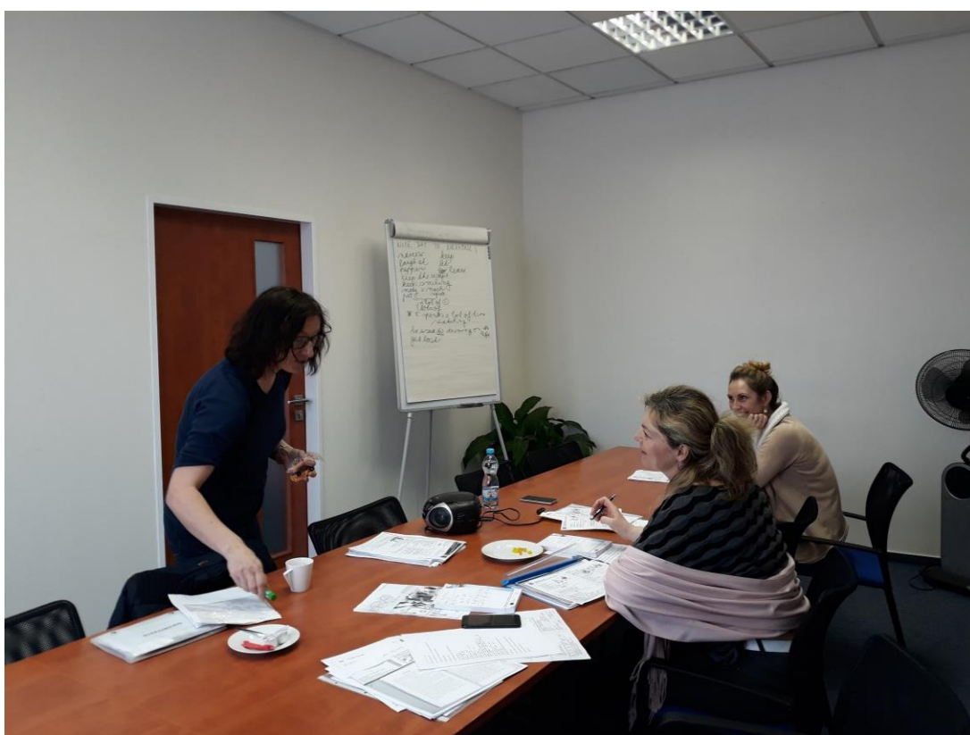
Probíhající výuka angličtiny

Již v listopadu 2018 nám byla žádost o příspěvek na vzdělávání schválena a od letošního února probíhá výuka angličtiny v prostorách kanceláře MAS ve Stodu. Prozatím jsme se pod vedením místní lektorky věnovali tématu efektivní písemné a telefonické komunikace, poté budeme zdokonalovat své prezentační dovednosti s využitím témat představení regionu, naší organizace a dotačních programů. Od května máme naplánovanou výuku německého jazyka – v současné době hledáme vhodného lektora, s nímž připravíme časový harmonogram výuky.