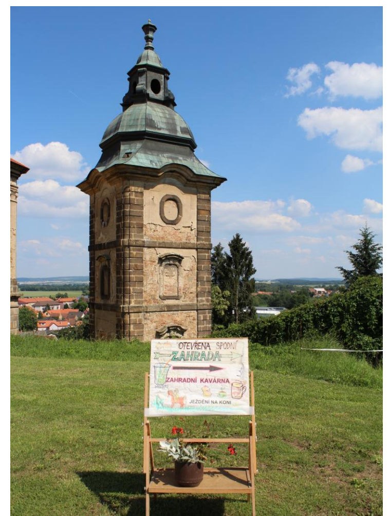
Slavnosti slunovratu v Chotěšově 2018

To jen pro začátek – jak již bylo psáno na začátku, akci stále ladíme a pilujeme do těch nejmenších detailů, bližší a aktuální informace se proto budete průběžně dozvídat na našem facebooku .