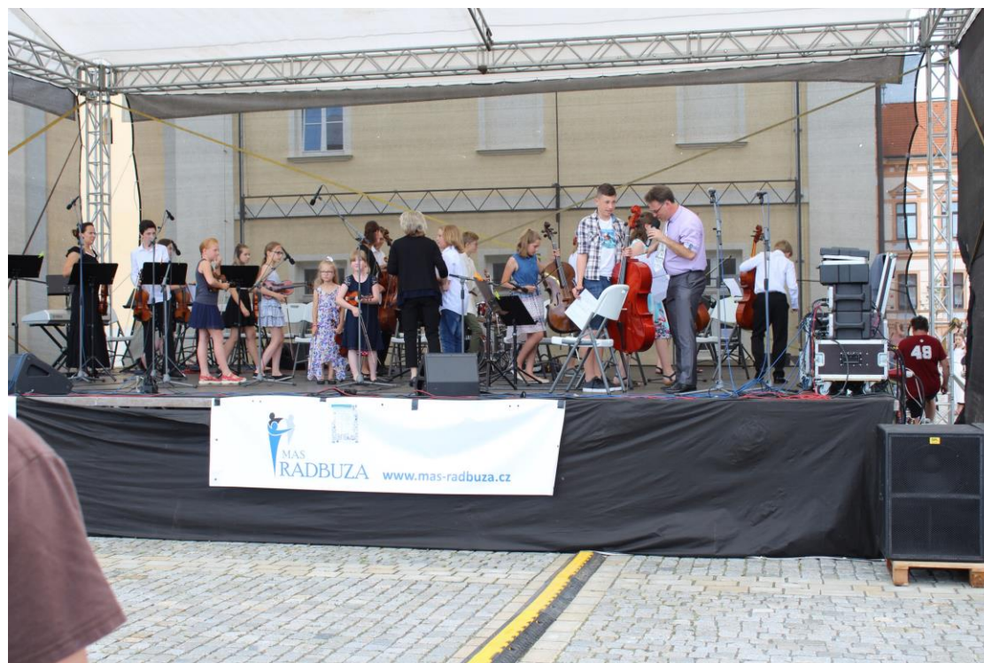
Dobřanské ZUŠkování 2018

Pilotní ročník ZUŠ Open se konal v Dobřanech, kde návštěvníci mohli vidět to nejlepší z toho, co místní mladí umělci dovedou a sami se aktivně zapojit v rámci různých kreativních dílen.