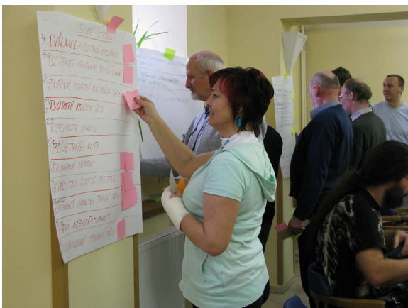
SWOT analýza území MAS Radbuza – pracovní část