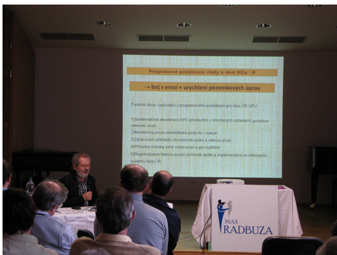
Ze semináře „Vliv eroze a komplexních úprav...“

Jejich přednášky byly zaměřeny na informace o geoinformačních vrstvách jako podkladu pro nastavení správných postupů při ochraně půdy, ukázky možností jejich využití a legislativní nástroje aj. Posledním bodem programu bylo seznámení s geoportálem SOWAC GIS a jeho využitím v praxi. Přednášející vysvětlili zúčastněným způsob a využití získaných dat na mapovém serveru. Na závěr byla představena budoucí vize a chystané novinky včetně portálu na monitoring eroze zemědělské půdy.