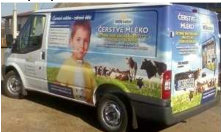
Rozvozový vůz farmy Milknatur

Po vydání výrobku obsluhou se vůz vydá na další stanoviště. Další rozvozová místa se nachází převážně v sídlištích po celé Plzni včetně Lochotína, Skvrňan, Vinic, Lobež či Bolevce. Některé trasy vedou i mimo Plzeň. Vozy na svých cestách míří i do Křimic, Vejprnic, Starého Plzeňce, Štáhlav, do Rokycan aj.