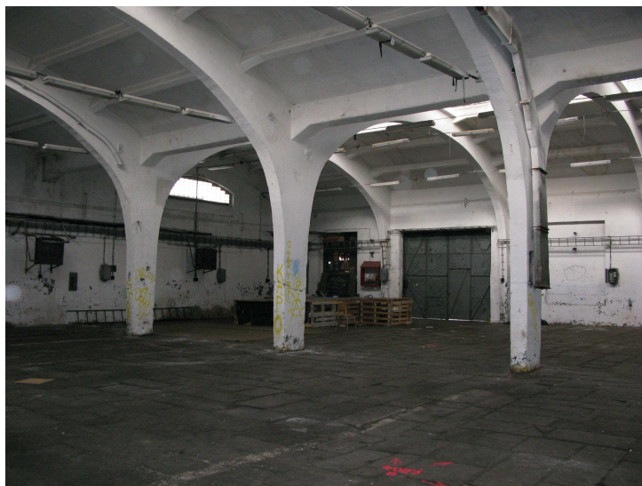
Prostory ve Světovaru, místo konání jedné z akcí v rámci projektu

Celkové výdaje projektu jsou téměř 3,7 milionů korun, z toho podíl MAS Radbuza činí 371,6 tisíc korun. Výše dotace pak činí 90% z celkových výdajů projektu. Výsledky tohoto kola podávání žádostí budou známy přibližně do konce května.