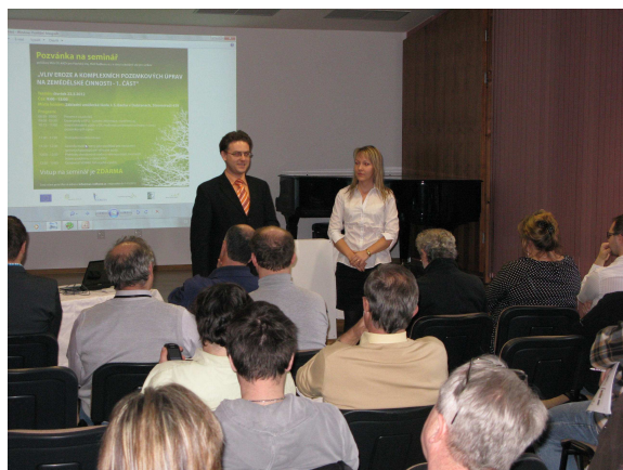
Ze semináře „Vliv eroze a komplexních úprav...“