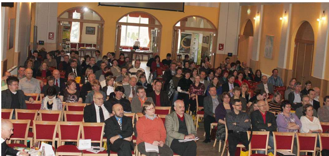
Z jednání Valné hromady NS MAS ČR - převzato ze Zpravodaje venkova 4-2012

Další informace k činnosti NS MAS ČR jsou k dispozici na jejich webových stránkách, především pod záložkou Dokumenty ( http://www.nsmas.cz/index.php?id=zobraz_dokumenty.php ).