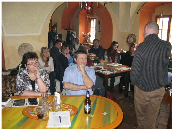
Z jednání KS MAS Plzeňského kraje v Teplé

Dne 9.3. proběhlo v Teplé již 12. setkání MAS Plzeňského kraje. Na setkání se zástupci MAS dozvěděli novinky z Národní sítě MAS ČR. Pro naši MAS byla nejdůležitější informací zpráva o přípravě nové osy III.4.1 Osvojování schopností a animace, kde by pro dosud nepodpořené nebo nově vzniklé MAS měly být prostředky v přibližné výši 500 tisíc korun na jednu MAS při 100% podílu dotace. Tyto prostředky jsou vázány na koučing od zkušenější MAS, mzdové náklady, propagační materiály, „zkušební“ projekt, vzdělávání, poradenské služby a další. V této souvislosti jsme proto oficiálně navázali partnerství s MAS Český západ a MAS Aktivios, jako zkušenými MASKami v kraji, které nám budou v rámci tohoto projektu nápomocné. Dalšími tématy setkání pak byly značení regionálních produktů a informativní zprávy z PK a KAZV PK.