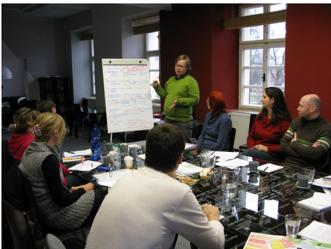
Z jednání MAS Plzeňského kraje a zástupců o.p.s. Plzeň 2015

Záměrem o.p.s. Plzeň 2015 je, aby rámec akce přesáhl hranice Plzně a nabídl tak turistům kulturní zážitky na území celého kraje. Zástupci o.p.s. proto oslovili mimo jiných subjektů rovněž místní akční skupiny na území Plzeňského kraje ve snaze spolupracovat na tomto projektu.