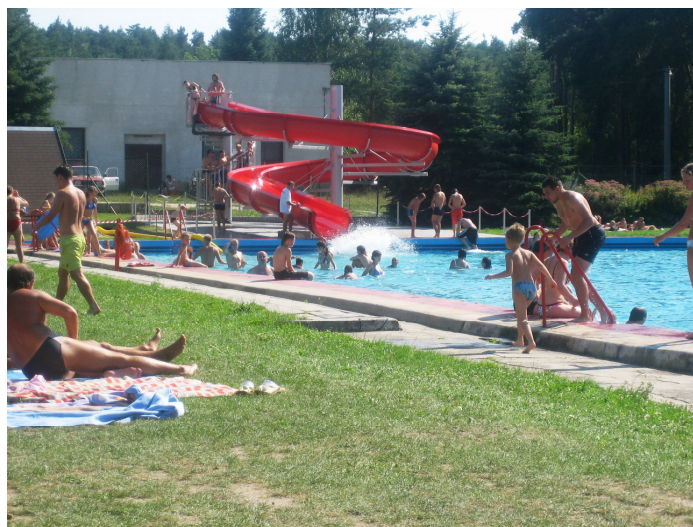
Koupaliště v Nýřanech před rekonstrukcí