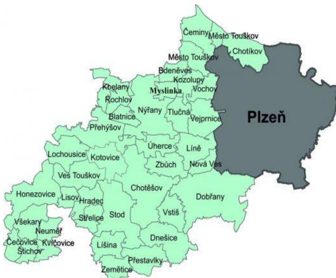
Obr. 2 – Mapa zájmového území MAS Radbuza