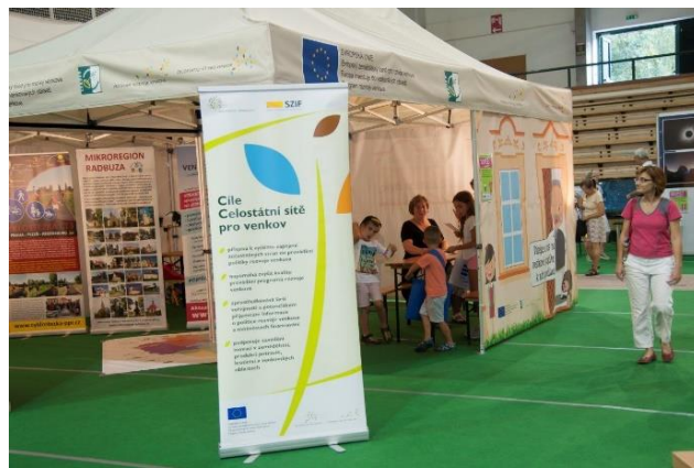
Obr. 6 – Foto ITEP 2018 (Plzeň)