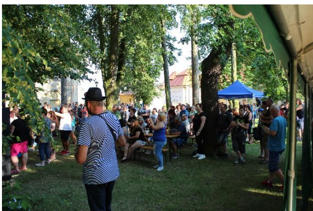
Obr. 5 – Foto z akce Slavnosti slunovratu