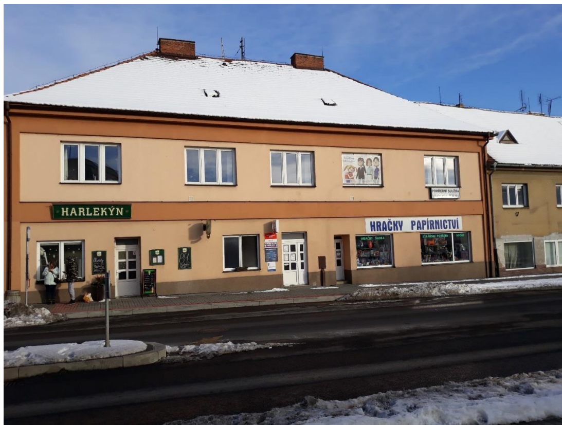
Obr. 1 – Sídlo MAS Radbuza, nám. ČSA 24, 333 01 Stod