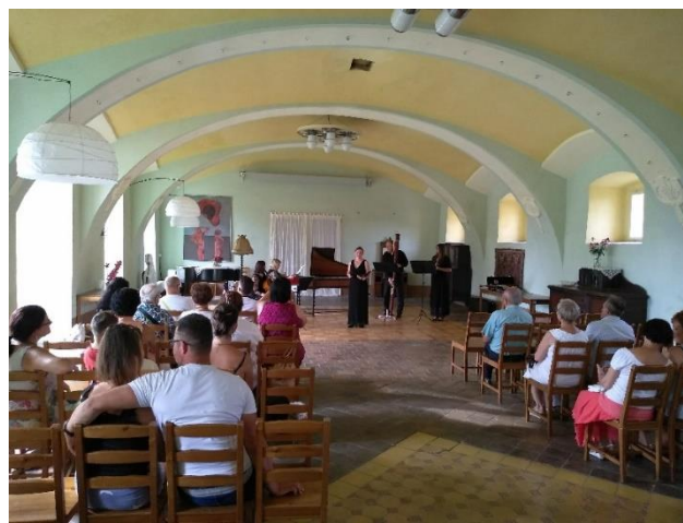
Obr. 3 a 4 – Foto z akce Baroko na Bylinkovém panství