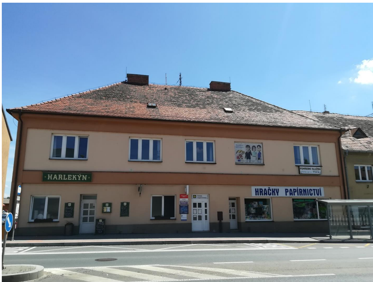
Obr. 1 - Sídlo MAS Radbuza 1, nám. ČSA 24, 333 01 Stod