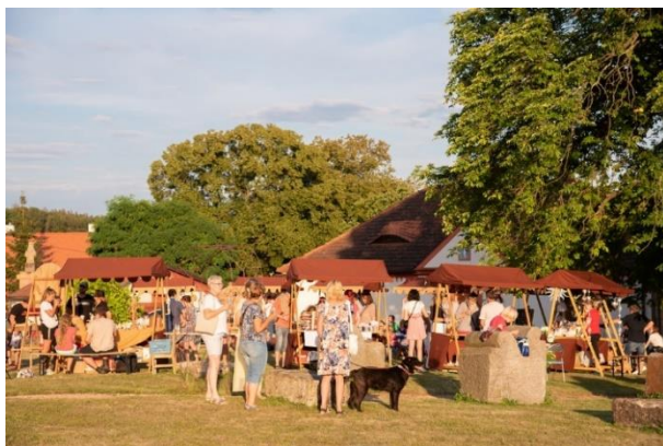
Obr. 3 - Foto z akce Baroko na Bylinkovém panství Rochlov