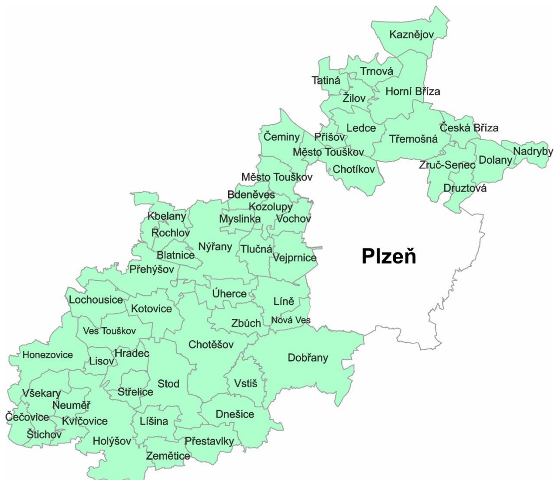
Obr. 2 - Mapa zájmového území MAS Radbuza