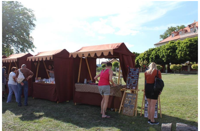
Obr. 3 a 4 – Foto z akce Baroko na Bylinkovém panství