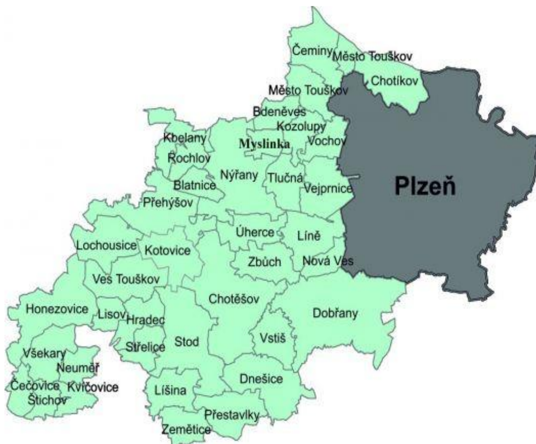
Obr. 2 – Mapa zájmového území MAS Radbuza