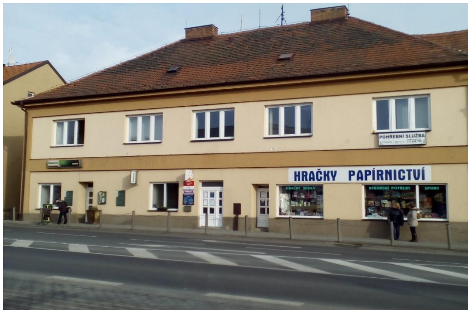
Obr. 1 – Sídlo MAS Radbuza, nám. ČSA 24, 333 01 Stod