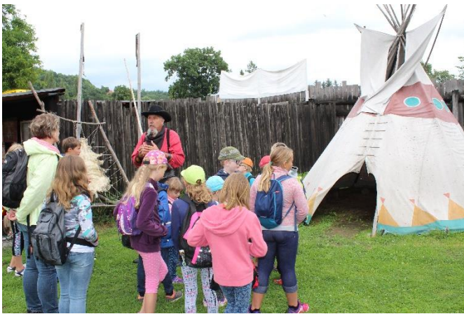
Obr. 5 – Letní animační soustředění – Westpark Plzeň