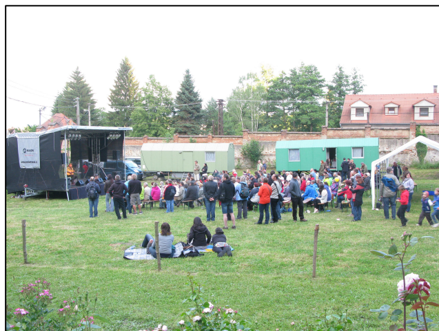
Zaplníme opět společně hlediště?