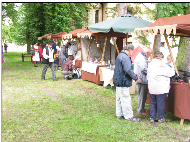
I letos se budou na akci prezentovat lokální řemeslníci

Neméně důležitým cílem akce je pak prezentace samotné Místní akční skupiny Radbuza, jejího bavorského partnera a partnerských mikroregionů - Mikroregionu Radbuza a Mikroregionu Touškovsko. V rámci Česko-bavorské spolupráce dojde k výměně zkušeností mezi lokálními producenty, k jejich vzájemné prezentaci a rovněž k navázání nových kontaktů.