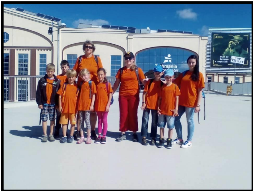
Obr. 8 – Letní animační soustředění – Techmania (Plzeň)