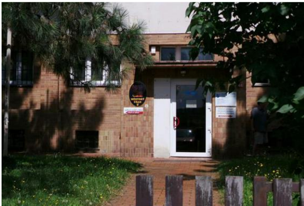
Obr. 1 – Sídlo MAS Radbuza, Sokolská 556, 333 01 Stod