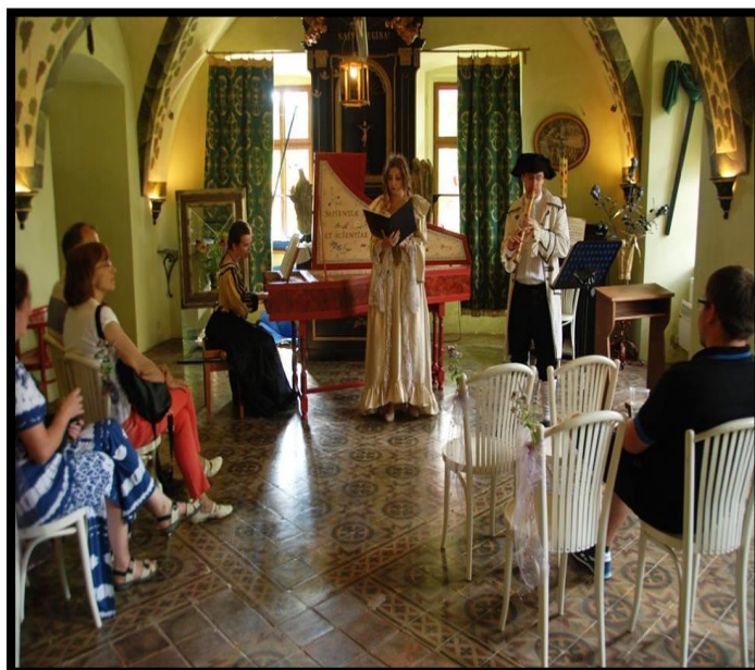
Obr. 7 – Koncert barokní hudby (Vejprnice)