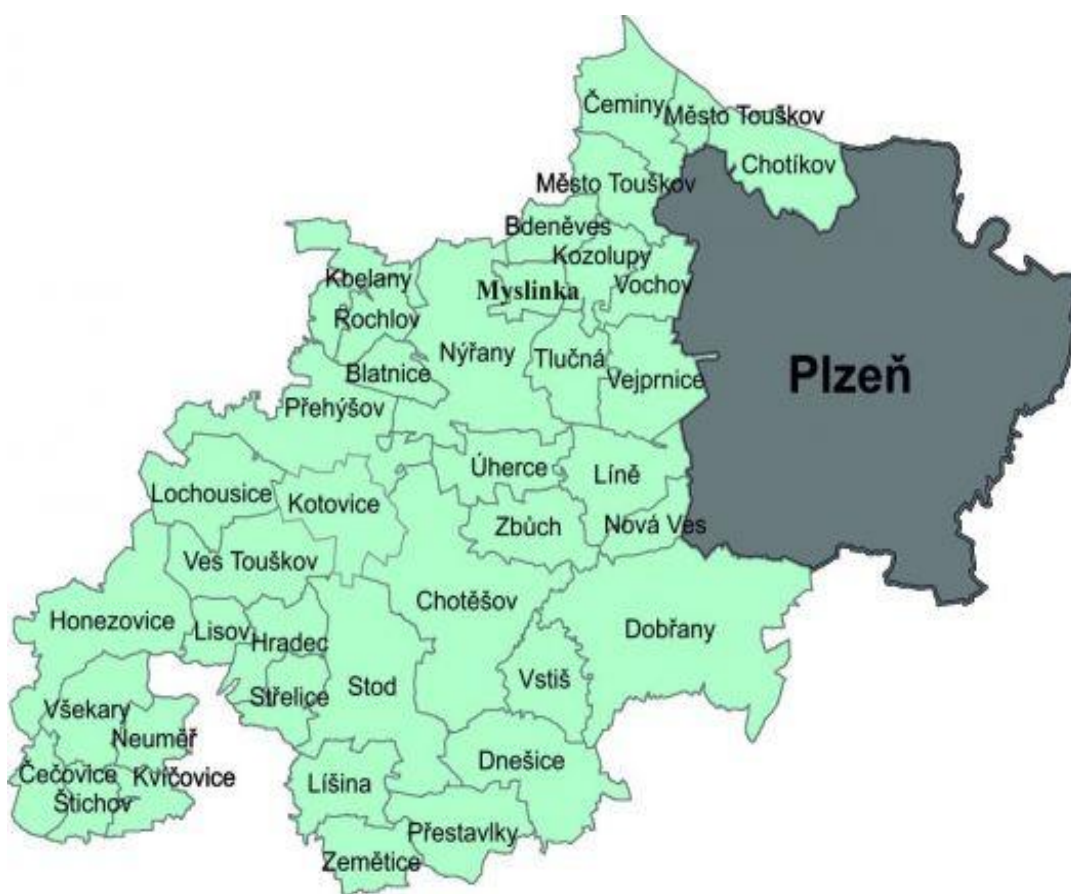
Obr. 3 – Mapa zájmového území MAS Radbuza