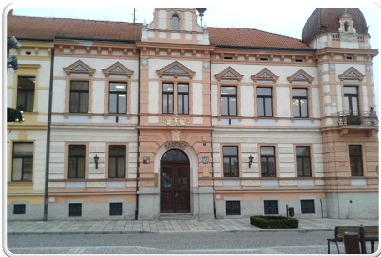
Obr. 1 – Sídlo MAS Radbuza, nám T. G. M 1, 334 41 Dobřany.