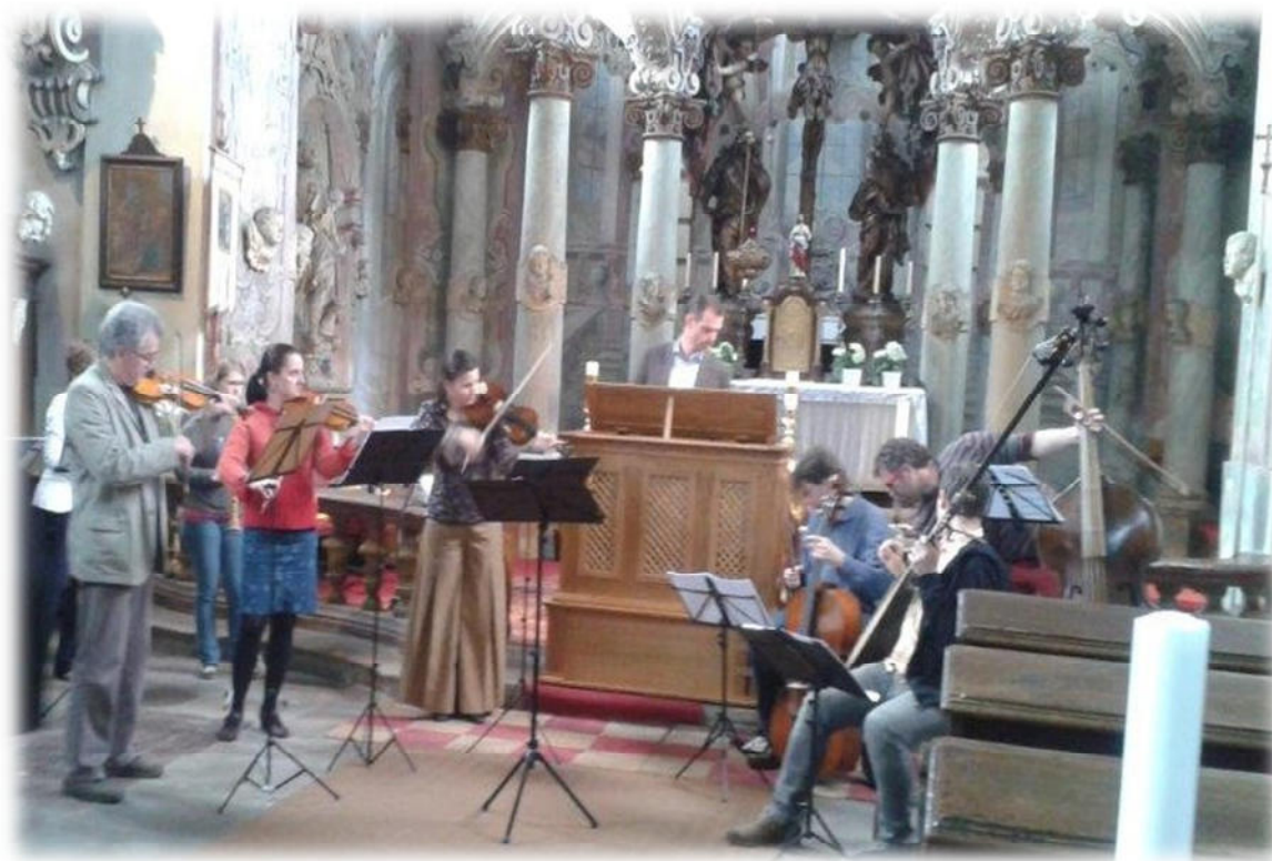
Obr. 5 – Koncert ve Vejprnicích

V roce 2014 v rámci realizace projektu proběhly akce Chotěšovský slunovrat, koncert kapely Ensemble Inégal v kostele ve Vejprnicích a přednáška na téma: „Byliny, rostliny a jejich využití v době baroka a v době současné“ na zámku Rochlov. Poslední akce, která se letos v rámci projektu uskutečnila, byl koncert barokní hudby v kostele sv. Víta v Dobřanech.